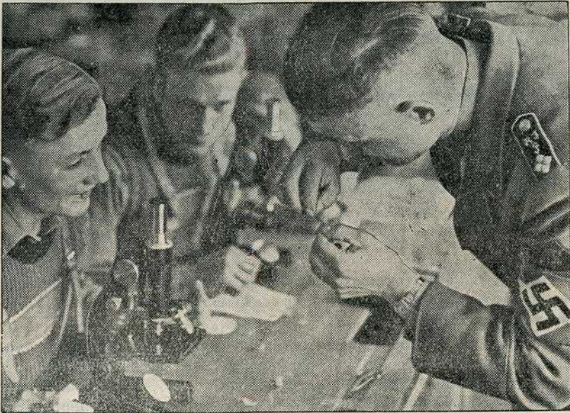
Научном раду се придаје велика важност. Овако стичу младићи опсежно знање.

Искуства последњих година у школском раду Адолф-Хитлерових школа показала су да тако схватање духовног, карактерног и телесног васпитања даје боље резултате него настава појединачних предмета у распореду часова.