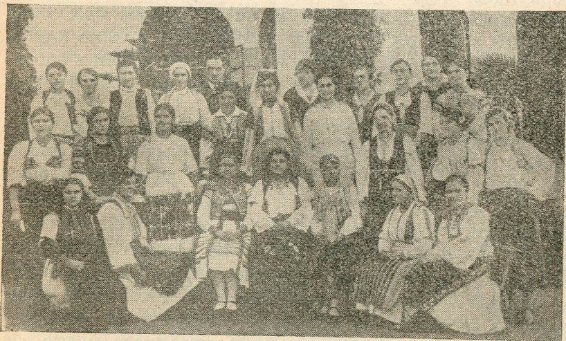
Трећи шечај домаћичке школе Краљ. фонда у Каменици.

Брига за напредак нашег села и народа, у коју сврху је Њ. В. Краљ наменио и свој фонд који носи Његово име, најјасније нам оцртава племените идеје у културном, просветном и економском погледу које Њ. В. гаји за добро најмногобројнијег али културно и највише заосталог нашег сељака и нашег села. Краљев Фонд је основан 1922 године под управом угледних и просветних радника; председник је г. Др. Богдан Гавриловић пред. Акад. Науке, г. Др. Александар Белић секретар Акад. Науке, г. Др. Живојин Ђорђевић и г. Тихомир Ђорђевић проф. Универзитета.