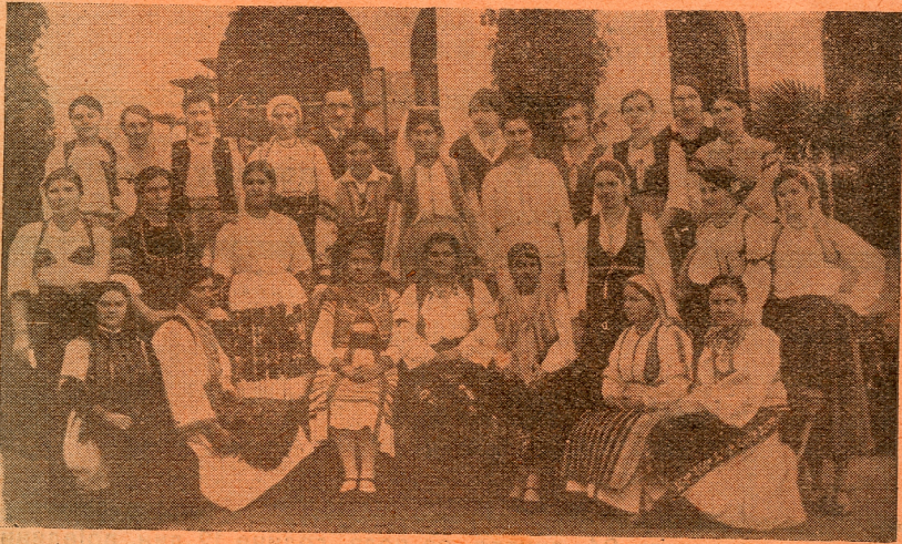
Трећи печај домаћичке школе Краљ. фонда у Каменици.