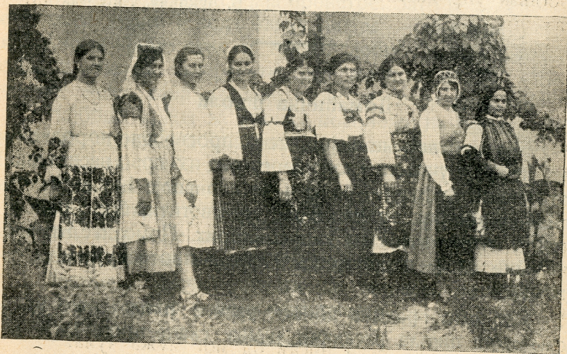
Група ученица у живописним ношњама, коју нису ни испуштали.

Наша народна ношња по селима пропада, избацује се ткано платно, купује се шифон и американ неки веле да је то јефтиније. Никада не може бити шифон јачи од домаћег платна. Изацујте свилу и кадифу, а ткајте саме своје дивно одело, за које се странци грабе и носе у своју земљу да се похвале шта су код нас нашли.