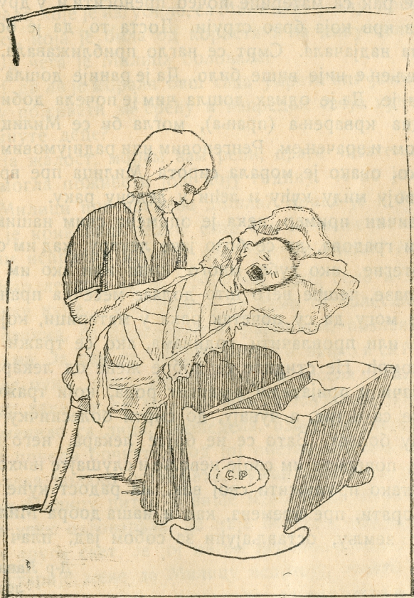
Мајка са одојчешом.

Разлике скоро никакве не постоји на селу између сиромашних и имућних породица у погледу хигијене. У сваком селу владају исти обичаји и за богате и за сиромашне. Сеоским мајкама су многи обичаји скоро светиње и тешко их остављају, јер је наш народ много сујевјеран. Под каквим се тешким условима порађа, и како се новорођенче доноси на свет, није никакво чудо што мала деца још у почетку свог живота силно страдају и умиру. Наша Сељанка ради и дању и ноћу, она се порађа и за време копања, жетве и других тешких радова, она се не штеди нити је ко у кући штеди, јер је