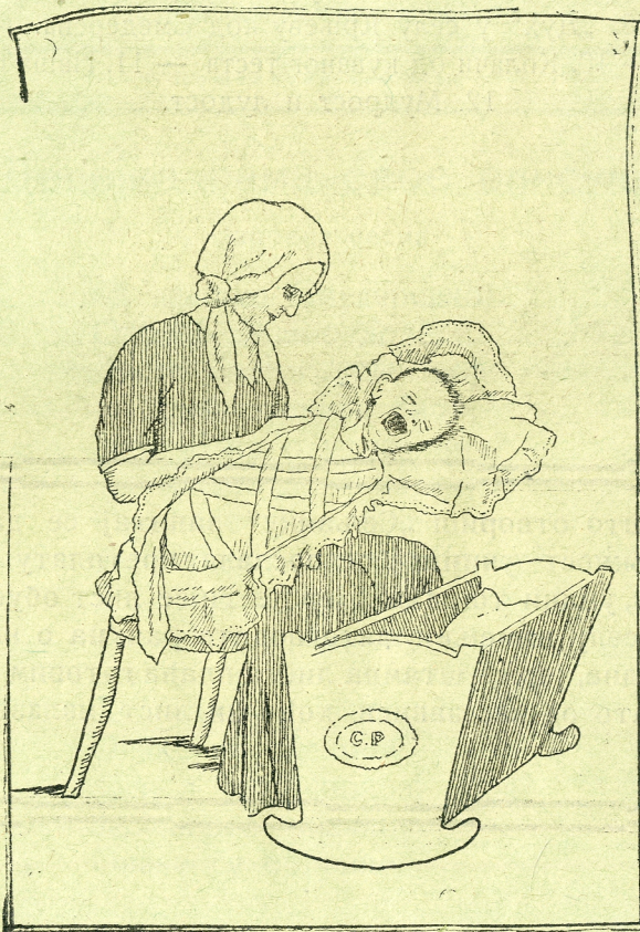
Мајка са одојчешом.

БЕОГРАД Штамперија „Скерлић“ — М. К. Цветановића — Краљице Наталије 12 — Телефон бр. 20.732