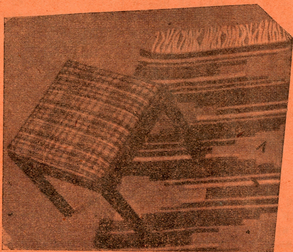
Крѝара на ѧоду и на сѧолицѧ