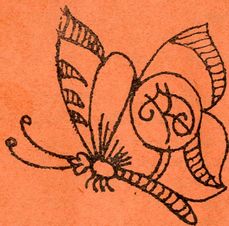
Лѧѧа шарѧца за марамѧѧе