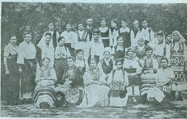
Седма година домаћичке школе Краљева фонда.