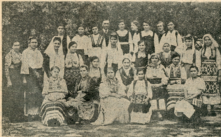
Седма година домаћичке школе Краљева фонди.

Ове године крајем октобра навршила се и седма година домаћичке школе Краљева фонда. У школи је било 25 ученица из свих крајева наше државе. Добре и вредне су биле наше и овогодишње милојке. Требало је видети њихову изложбу, која је задивила не само Каменицу него и Нови Сад.