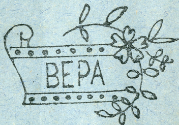
Лепа шара за вез