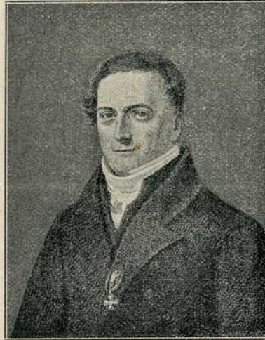
Сл. 1. Јохан Фридрих Хербарт.

Филозоф, психолог и педагог, Хербарт, рођен је 1776. год. Он