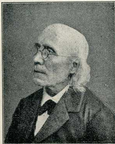
Сл. 2. Густав Теодор Фехнер.

4.) Он је оснивалац експериментално-психолошке естетике.