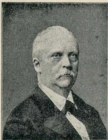
Сл. 3. Херман фон Хелмхолц.

што су тиме осјети обрађени на квалитативан начин — Фехнер се може узети као оснивалац психологије, представљајући коначни пролаз из квалитативне у