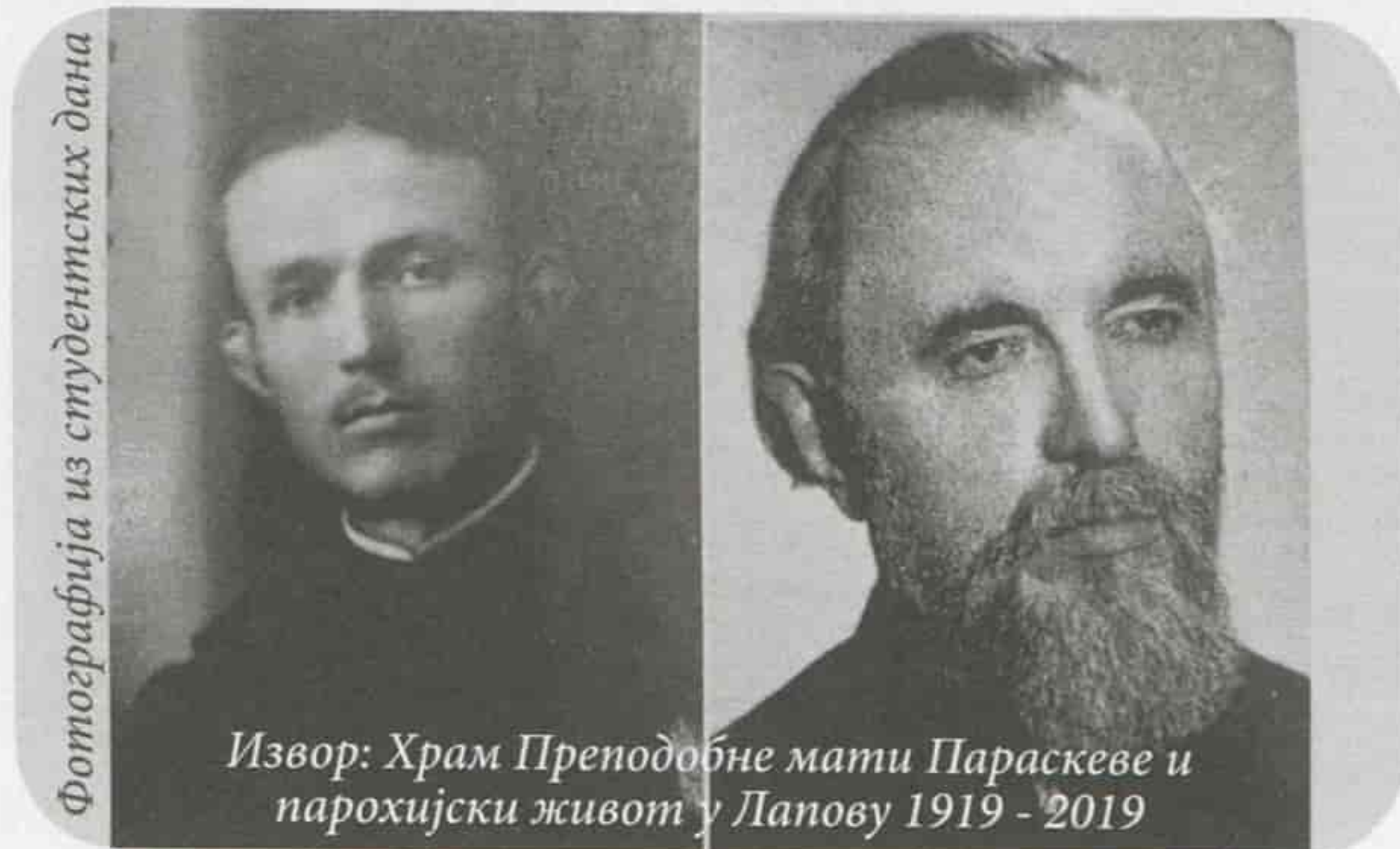
Фотографија из студентских дана

Сазнали смо и то да везе проте Маринковића, након доласка у Крагујевац са црквеном просветом и Призренском богословијом, нису прекинуте. Сваке године је од стране Светог архијерејског синода био делегиран за изасланика на матурским и разредним испитима. Одлазио је у Призрен и био радо виђен гост.