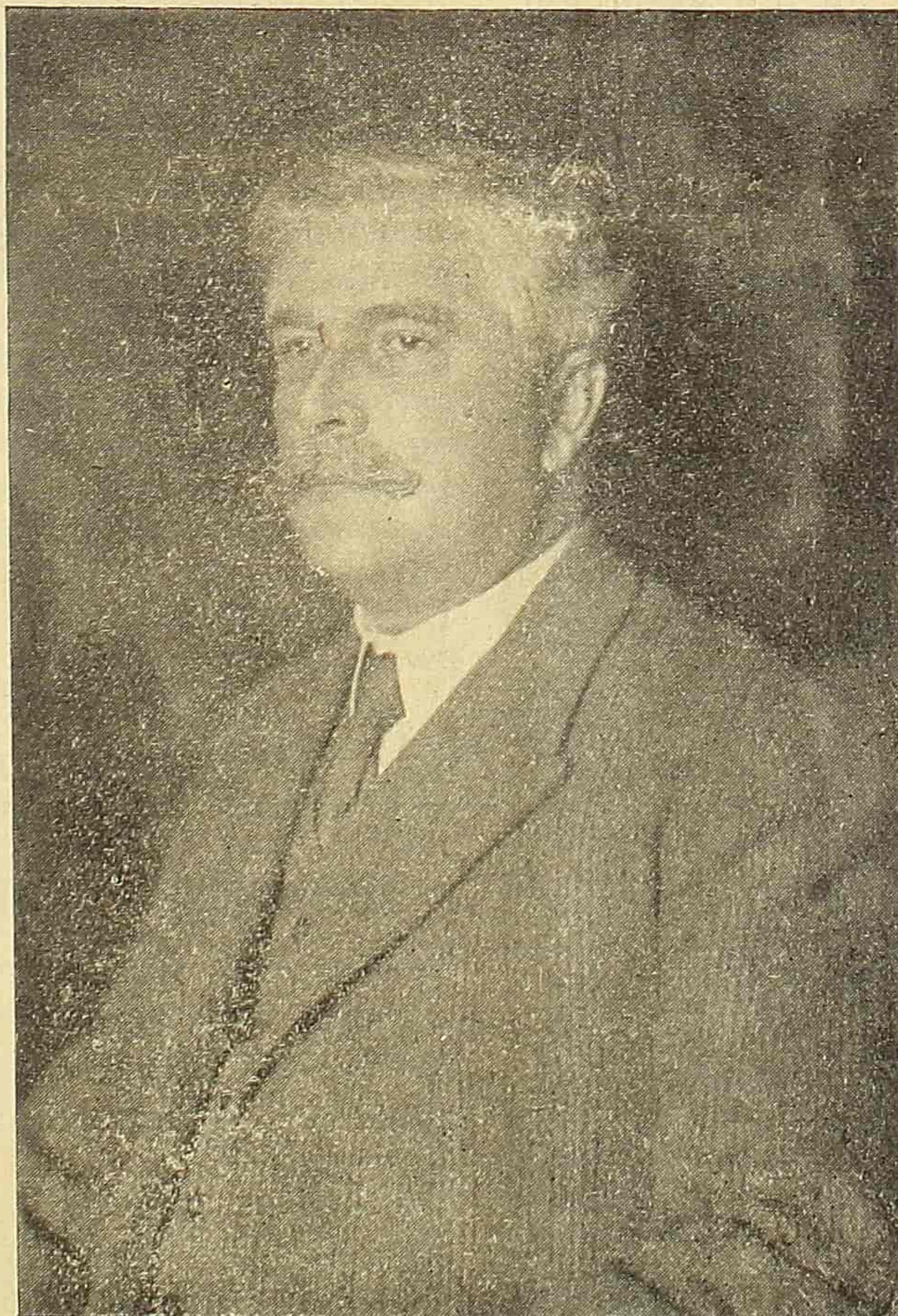
ЖИВОЈИН ЛАЗИЋ, Бан Вардарске Бановине

У Јужним пределима Бановине, који су почетком марта ове године пострадали од земљотреса, господин Бан се нарочито интересовао око обнове порушене насеља, која врло хитно