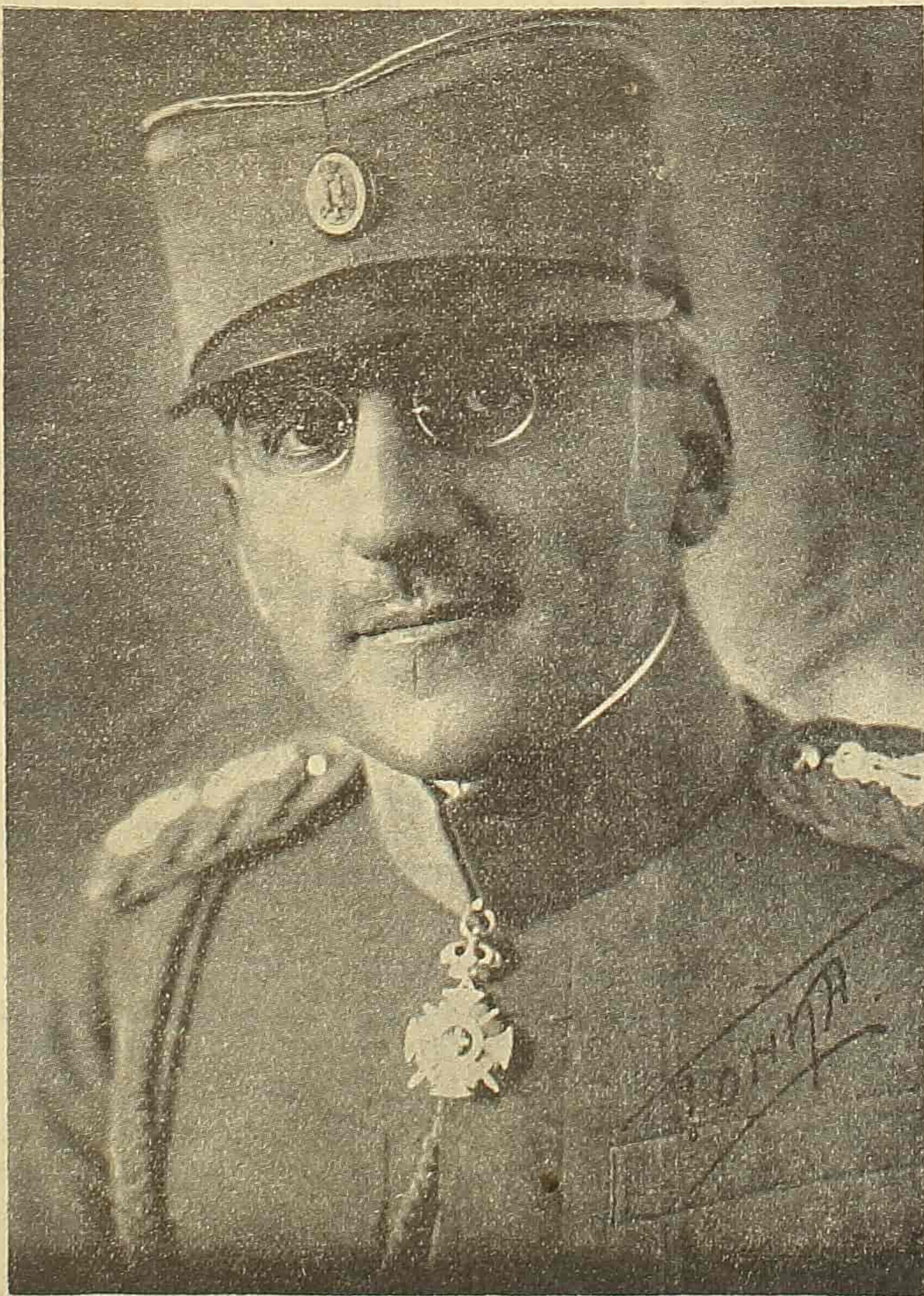
Њ. В. КРАЉ АЛЕКСАНДАР I. КАРАЂОРЂЕВИЋ Краљ Југославије

Познато је нашим читаоцима, да су седмог марта дошли изненадни потреси, који су проузроковали велике штете у срезovima: Неготинском, Бевђелиском и Дојранском и први међу првима, који је похитао међу по-