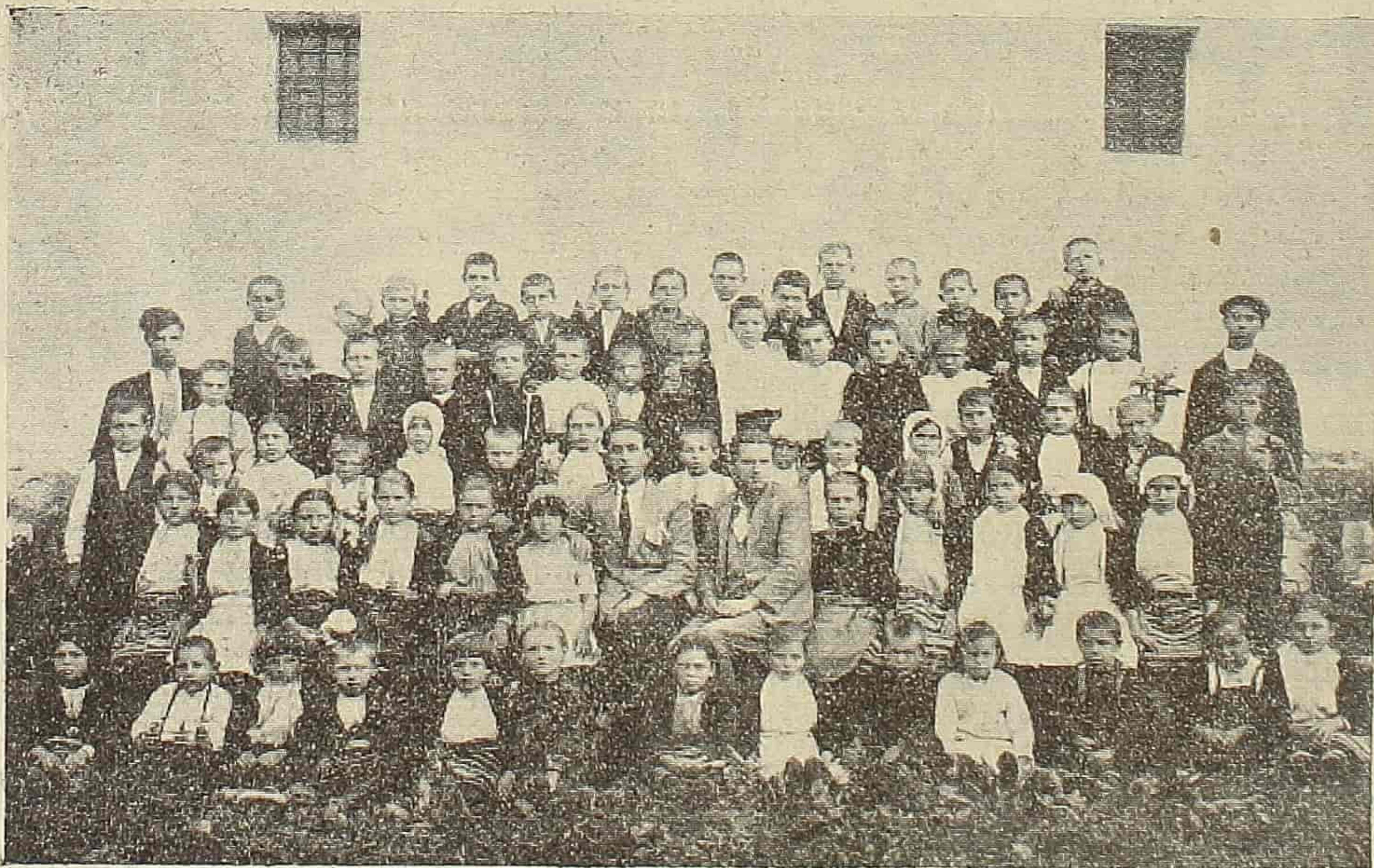
Ученици основне школе у с. Велмевцима

даље је у задужбинском одбору Министарства Просвете и уз то председник Удружења Јужносрбијанаца који је ово друштво веома задужио лепим успесима обезбедивши му и велики плац у вредности од 800.000 динара, који је Београдска општина поклонила на његово заузимање.