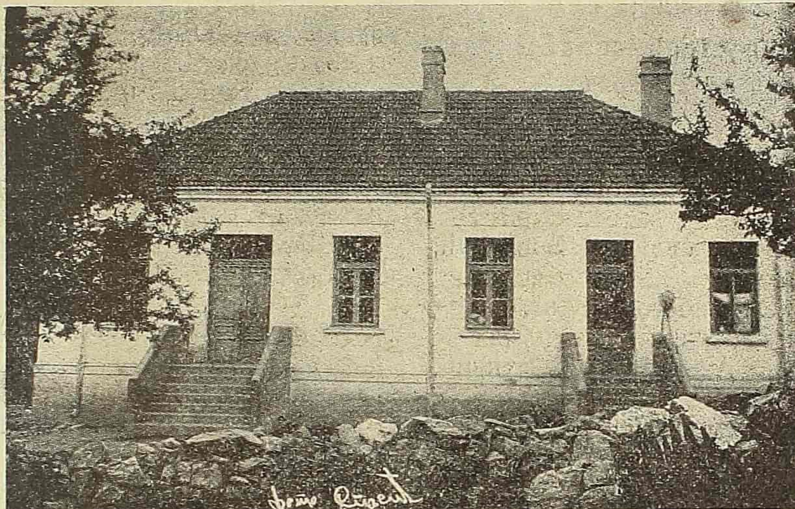
Школа у с. Челопеку