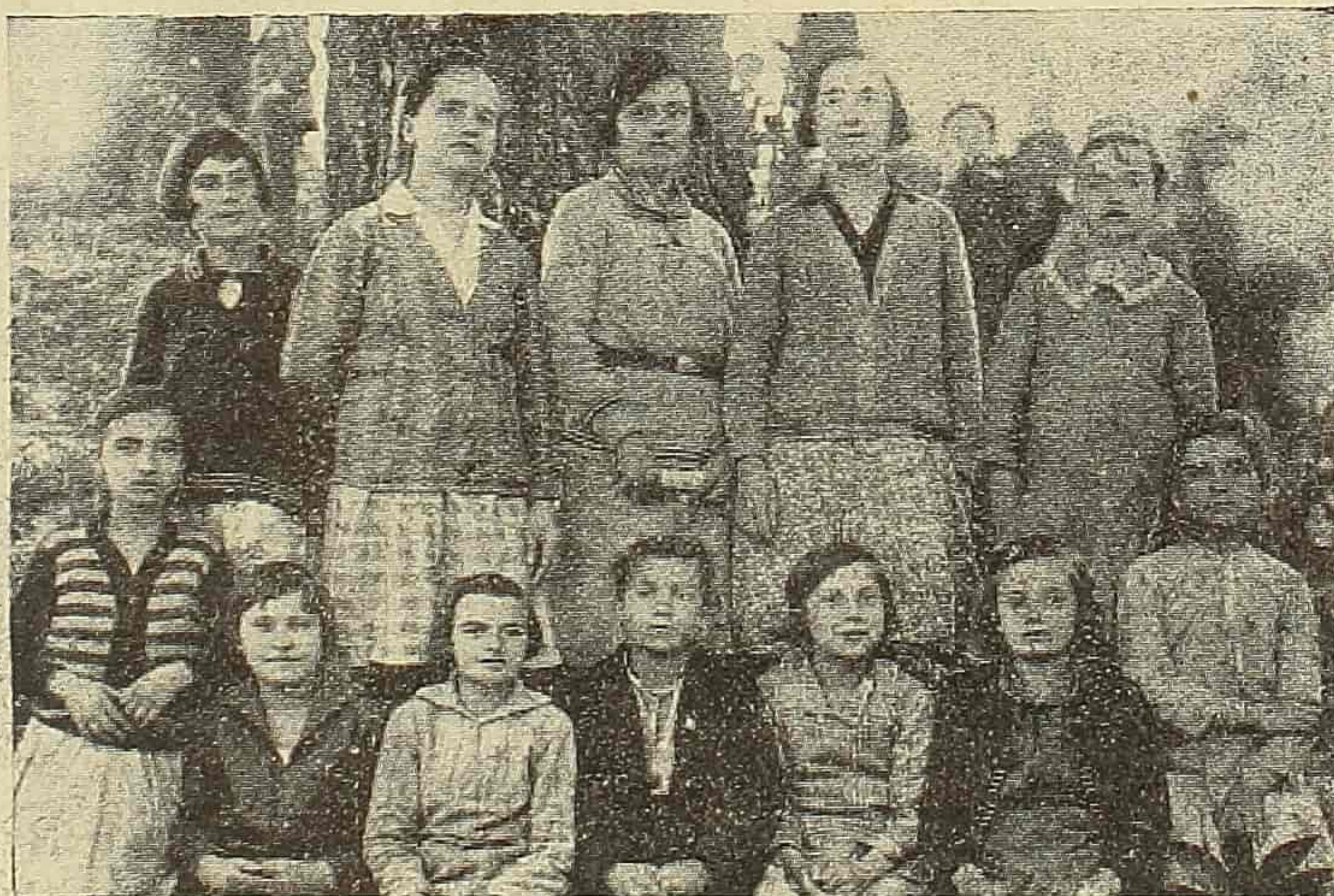
Ученице Женске Занатске школе у Кичеву