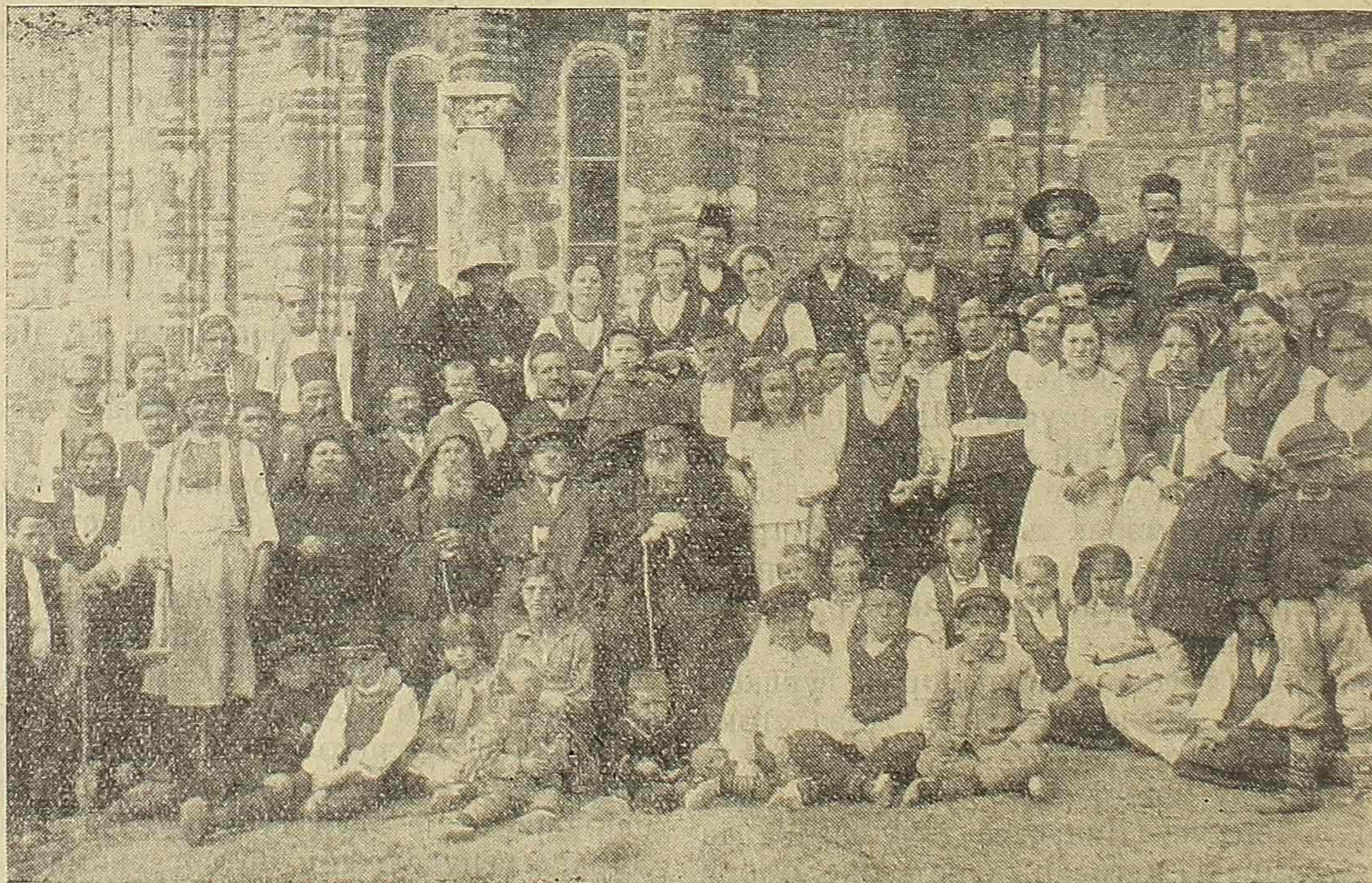
Братија Лесновског манастира са групом народа

Оралија је у овом крају врло ретка и при