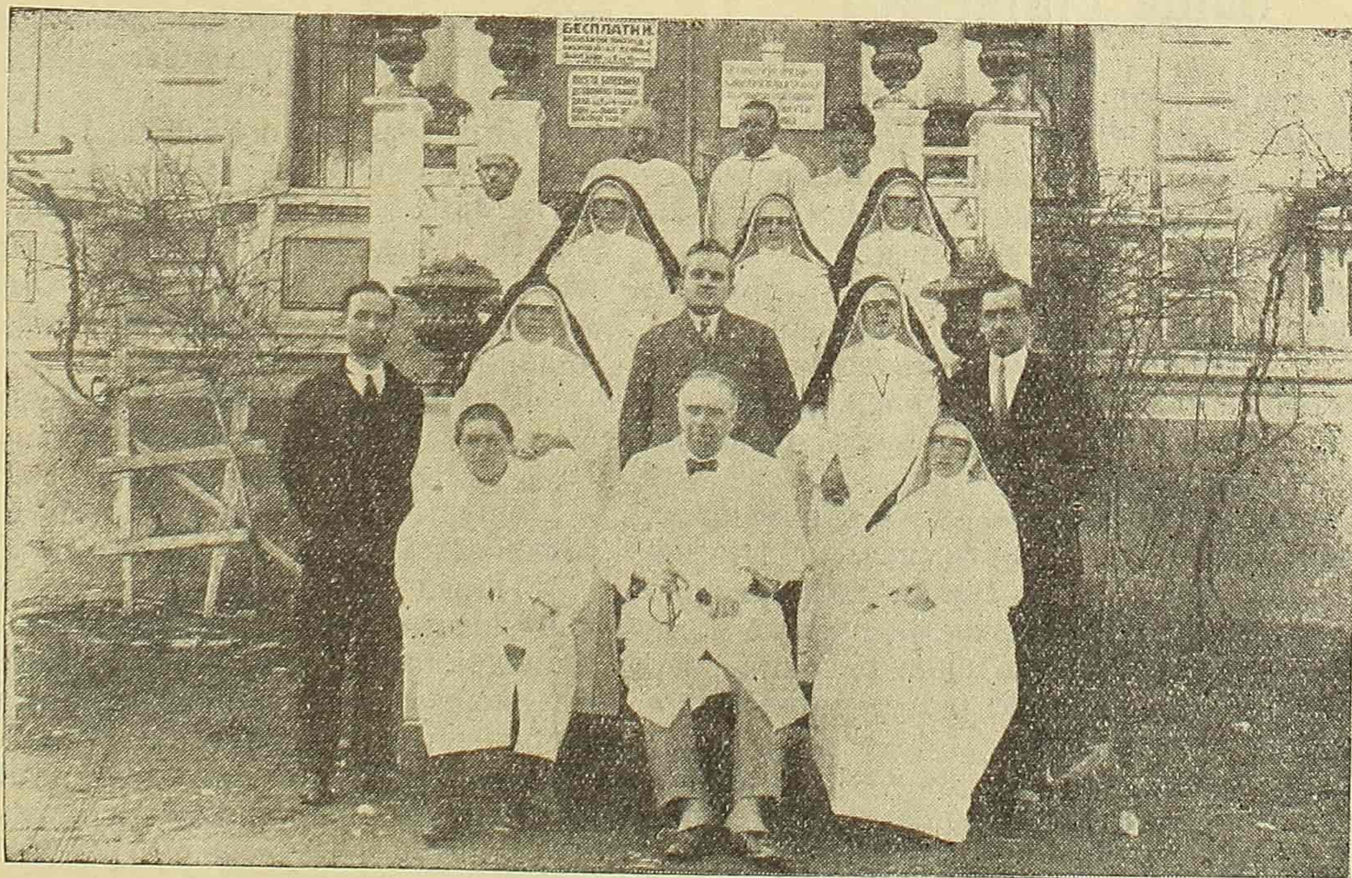
Особље бановинске болнице у Велесу.

Први почеци рада су били тешки, јер болница