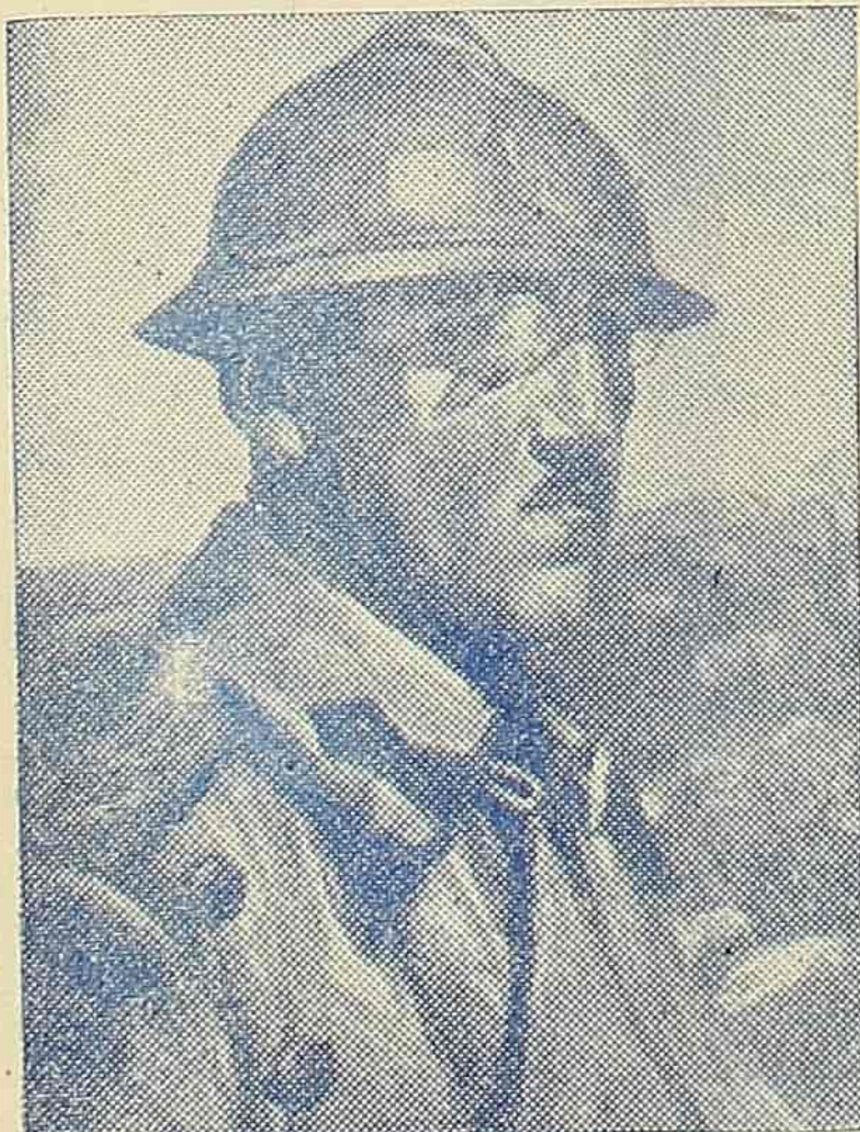
Блаженопочивши Витешки Краљ Александар I Ујединитељ

Центар Јужне Србије, Скопље ће и за прославу двадесетпетогодишњице њеног ослобођења бити центар свих