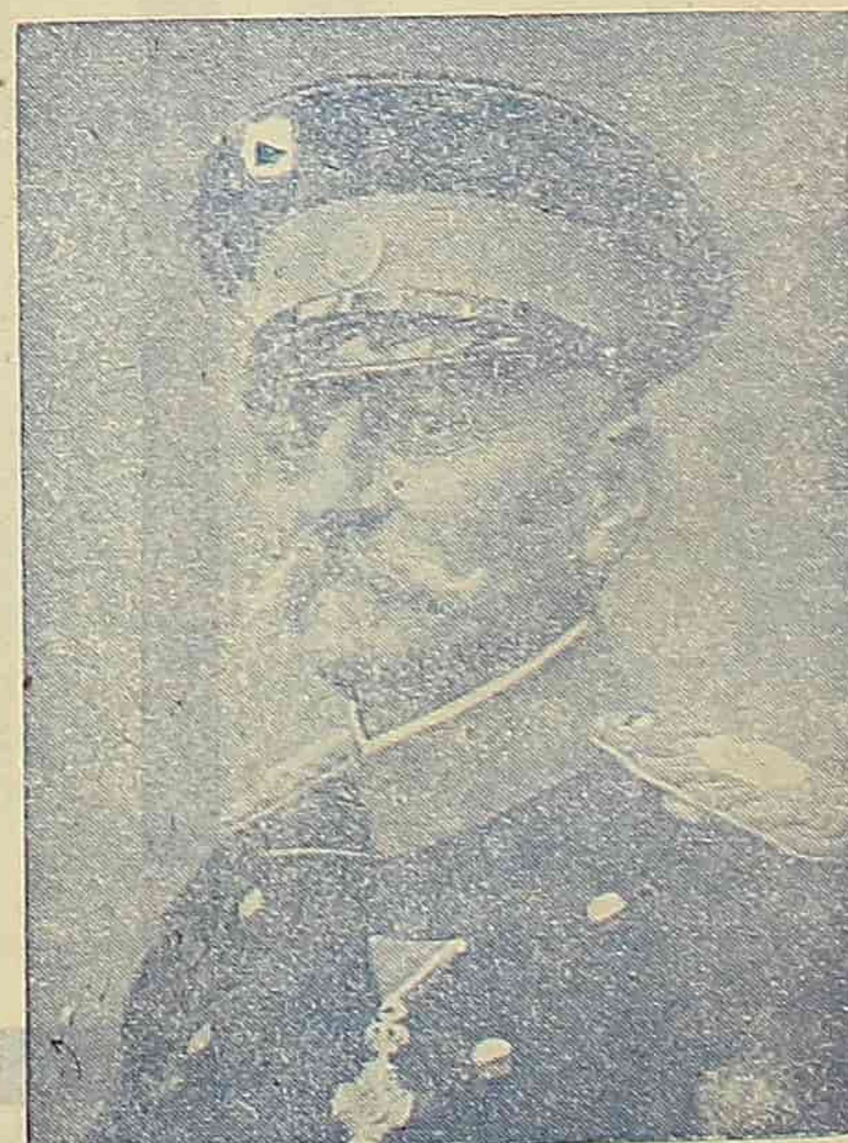
Блаженопочивши Краљ Петар I Велики Ослободилац