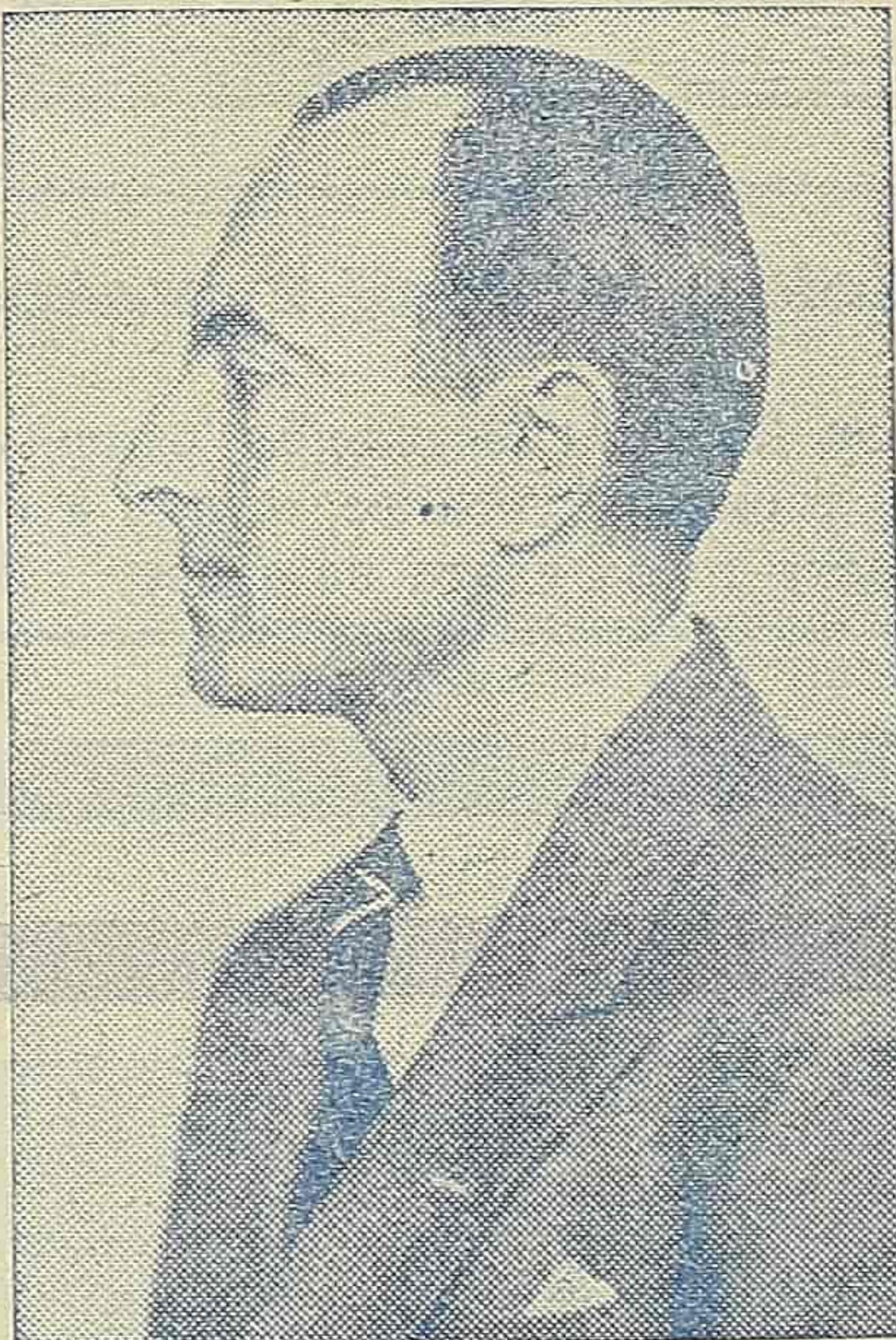
Њ. Кр. Вис. Кнез Намесник Павле

Душаново Скопље је и досад предњачило у величанствености свих националних свечаности Југа, а оно и данас, приликом прославе двадесетпетогодишњице свог о-