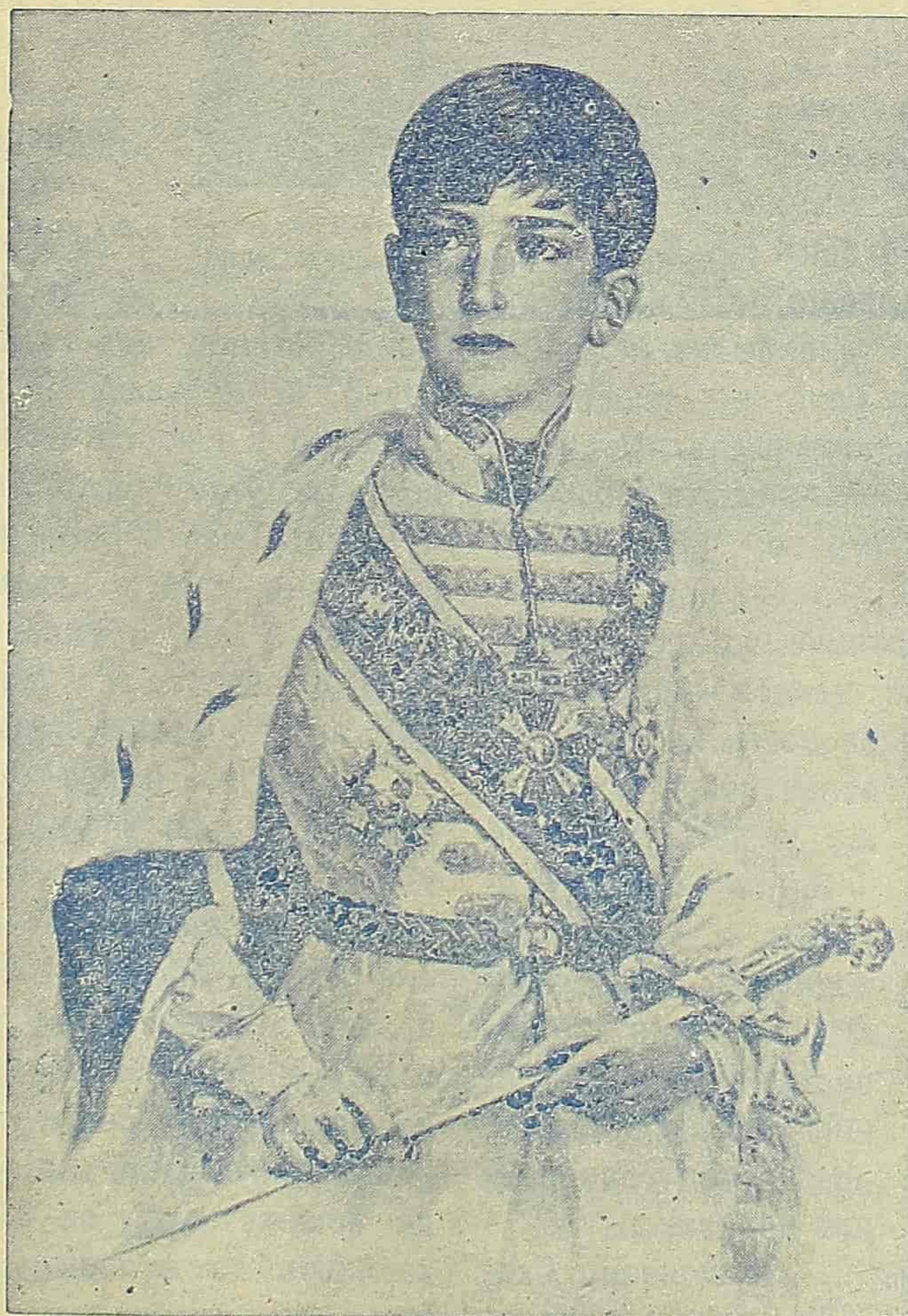
Његово Величанство Краљ Петар II

СЛУЖБЕНИ ЛИСТ излази једанпут недељно. Годишња претплата 80 динара. Огласи се примају по утврђеној тарифи. Рукописе, огласе и све што је у вези са штампањем у Службеном листу треба слати на адресу: Цара Николе 35.