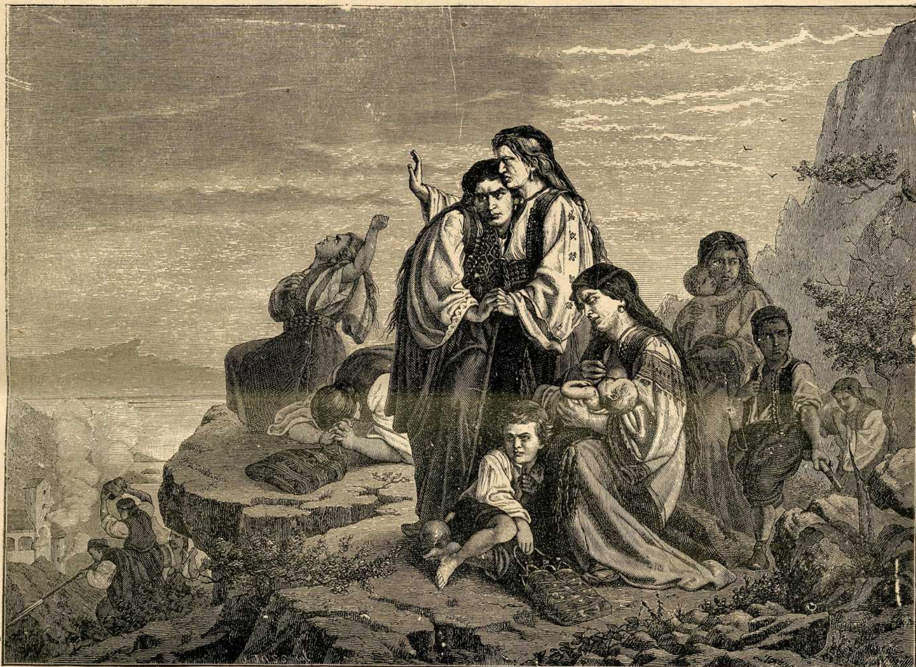
Херцеговачка нејач уклонила се од турског зулума.

Најбољи топови невриједу, ако неваљају топције. Покушаји у Бечу делани су све на одмјеренијем дистанцијама. Нека се српски топције извјежбају боље у процјени дистанција и у гађању у нишан, и нека је предпрега