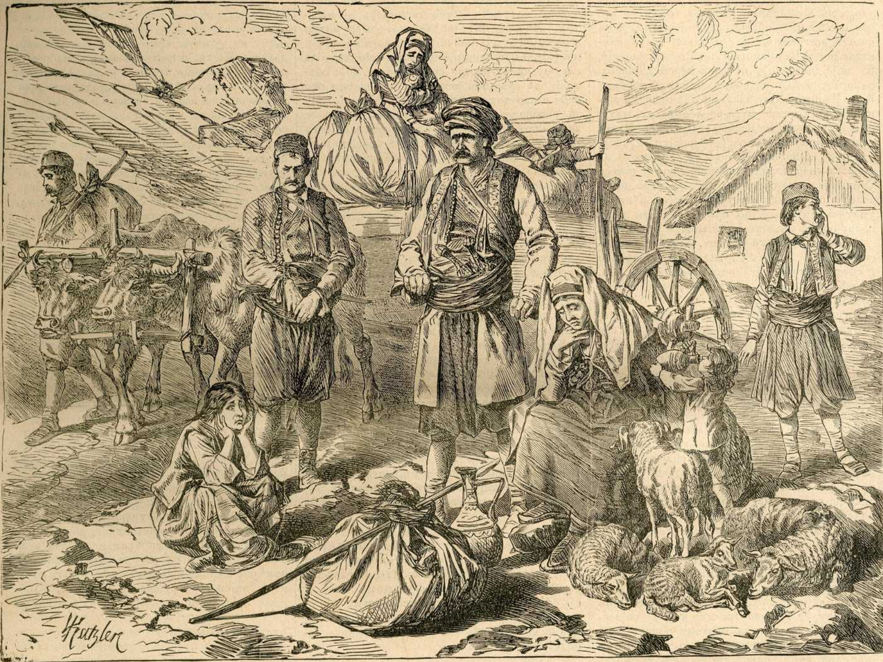
Херцеговачка раја на далматинској граници.

Песништво исто тако пада. Ако се стави на службу тенденцијама, онда се још помало трпи. Пева ли, описује ли човек унутарњи