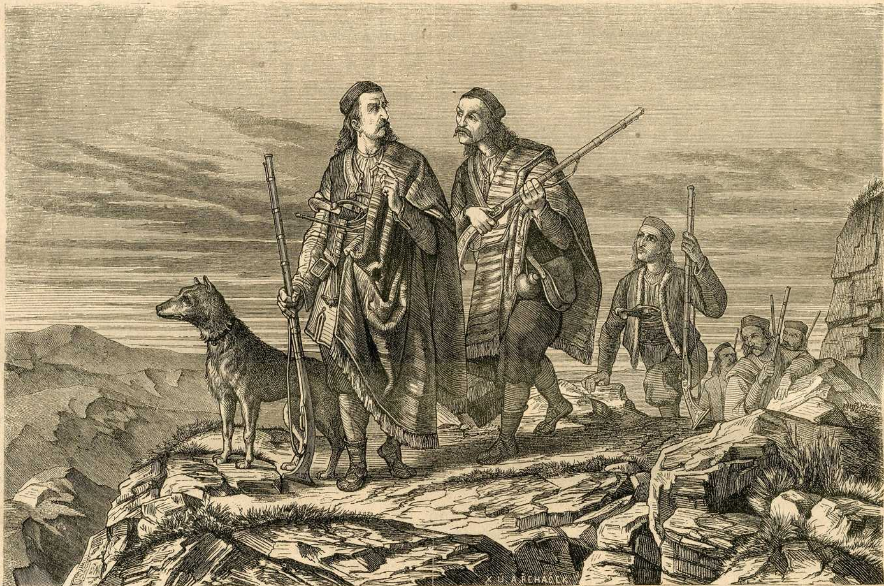
Устаници у Херцеговини.

Ништа друго до поглед на садашње стање нашег друштва, поглед, који их је испунио незадовољством према многим, тако немилим, а тако учесталим појавима. А који су то? Почнимо од себе, па умислима пођимо све даље и даље кругом друштвеним, и онда ћемо наићи на толке сведоке оскудости наше у општем образовању. Овде је довољно да наведемо само неколико примера.