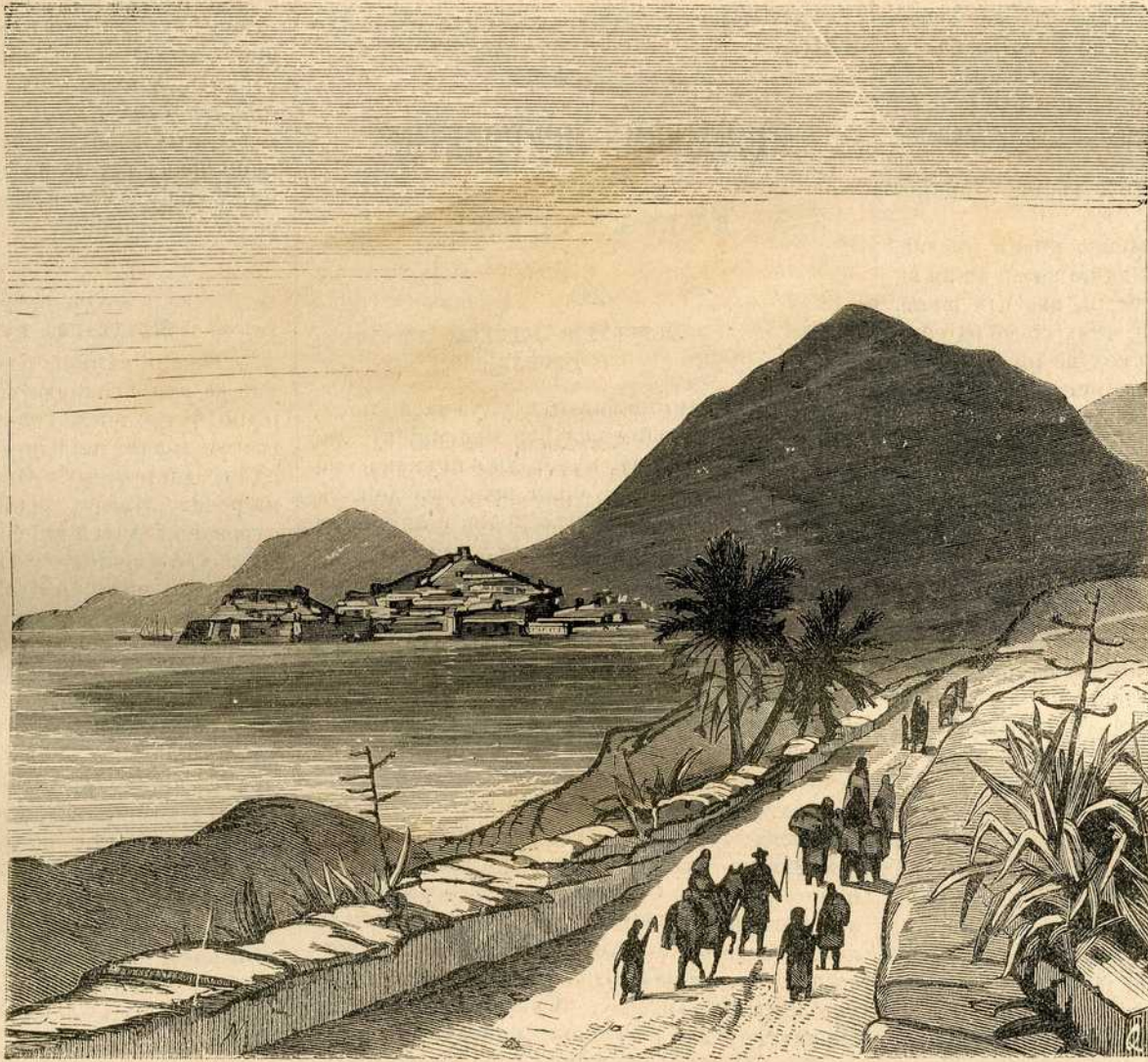
Друм из Дубровника у Херцеговину.