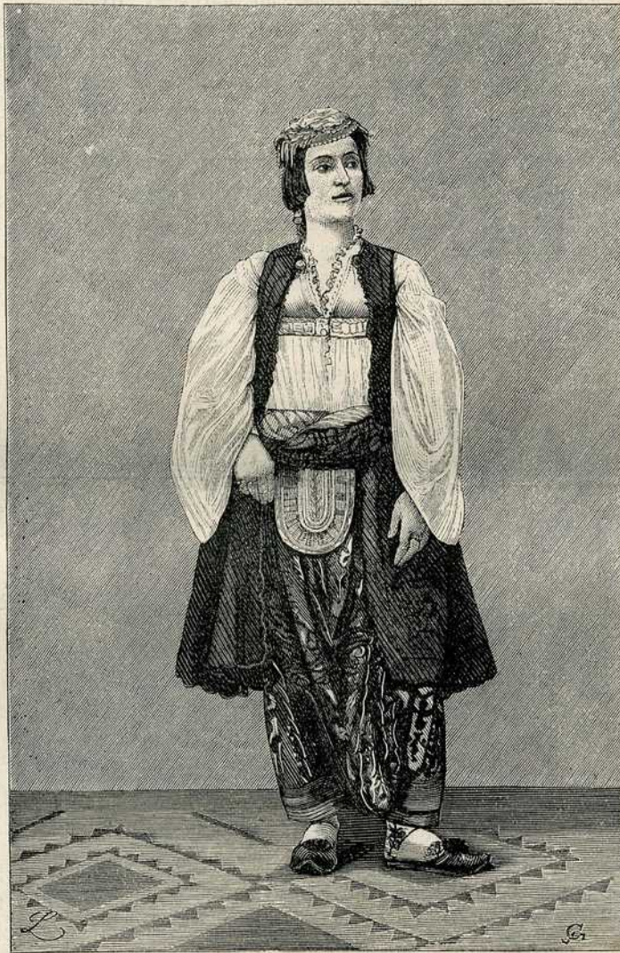
Слике из Старе Србије: СРПКИЊА МУХАМЕДАНСКЕ ВЕРЕ.

*) Овђе имају право, зато, што на божић од кад сване, па док се умрачи, никад се котао с' ватре не скида, јер се вазда у њему по нешто они дан вари.