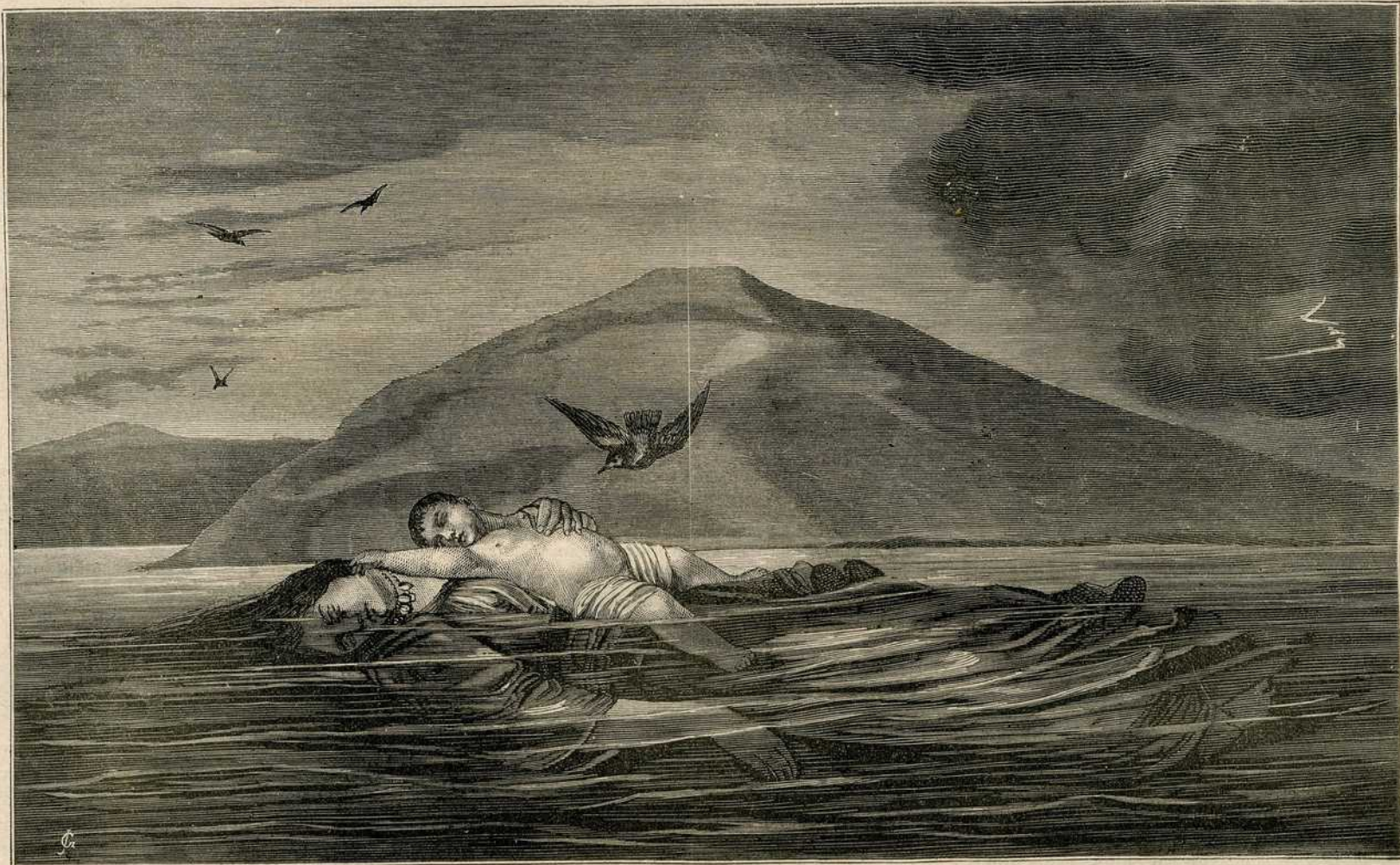
Утопљеница. Слика Ђорђа Кршика.

покушаја сам побуђен био намером да добијем кавени сок (екстракт), који би од услуге био путницима и војсци на маршевима, и при тој прилици сам најпре опазио уплив ваздуха или кисеоника ваздуха на каву, који квари јако добра својства каве; ја сам нашао да водени врели сок пржене каве, који се може још пити тазе, брзим или лаганим испарењем на високој или ниској топлоти у додиру са ваздухом изгуби пријатни укус мало по мало сасвим; и црна маса преостане, која се не раствара потпуно у ладној води, а због гадног укуса не може више да се пије.