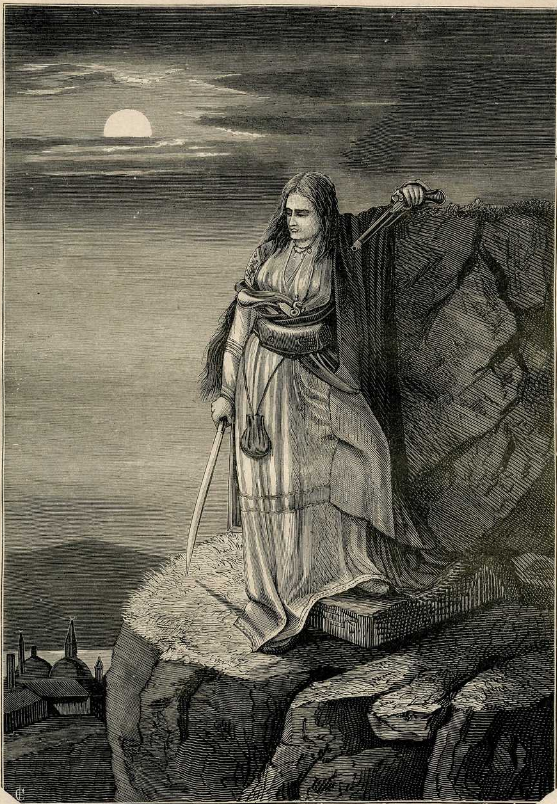
Херцеговка на стражи. Слика Ђорђа Крстића.

пржену цихорију и разне врсте рене, кад им се мало каве дода, и да су се кавени сурогати тако јако распространили. За млоге је затвореномрка чорба емфирематичног укуса кава. Чај сурогата нема, јер сваки ко га пије зна како он слади.