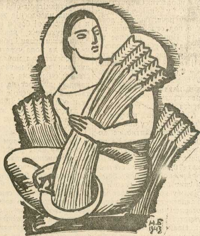
(Цртеж: Н. Бешевић)