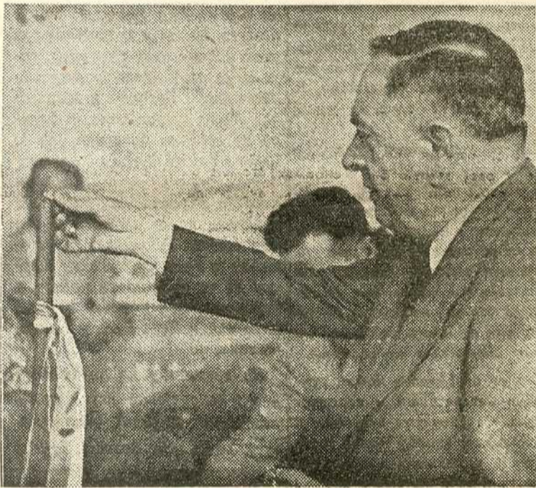
Генерал Недић пали свећу на освећењу Дома

У тим мислима ја сам данас присуствовао освећењу овога дома и оглашавам га овога момента отвореним за вас, драга моја радна и привредна омладина, са жељом