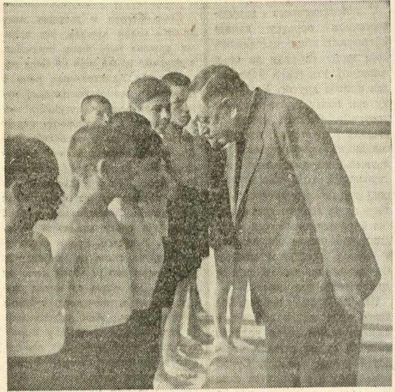
Генерал Недић присуствује вежбама шерта

Српска заједница рада, којој сам ја Старешина, а ви моја деца, данас је учинила једно велико дело: освећен је овај дом, дом радне и привредне омлади-