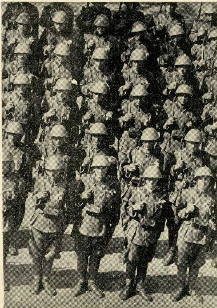
Добровољци пред полазак на терен