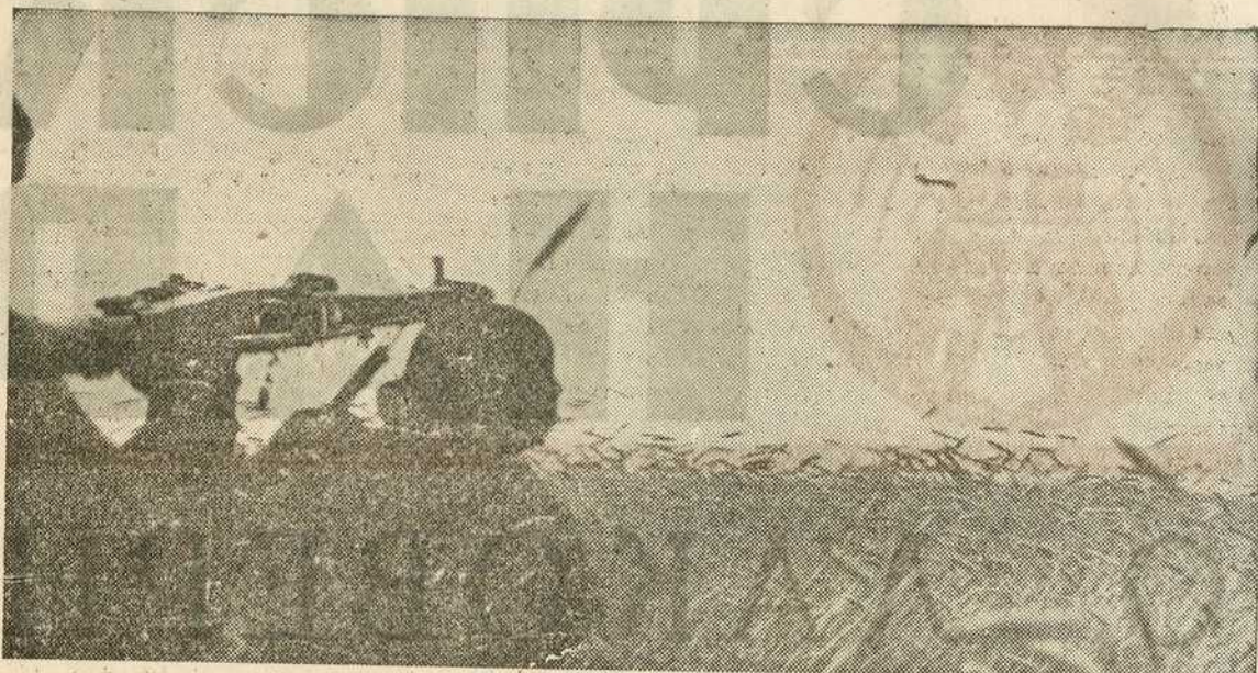
Један совјетски ловац уловљен од немачких митраљезаца