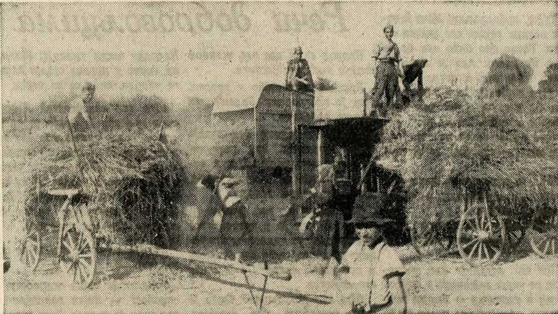
И ове године добровољци су помагали сељацима у радовима око жетве

Најбољи одговор на то питање дају непрестано свеже хумке и страдања српског народа.