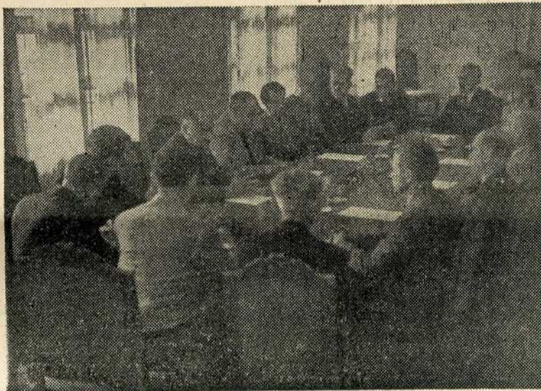
Председник Владе и министар просвете на конференцији са школским надзорницима

То је потребно да би српски народ могао да просперира у своме животу, да би могао да напредује на културном, привредном и економском пољу, то је потребно и зато, да кад цео народ западне у једну тешку ситуацију, као што је данас наш народ запао, да би могао да издржи све тешкоће у којима се нађе. Ми у прошлости нисмо тако радили, и због овога што данас преживљавамо криви смо сви. Сви ми за ово мора да сносимо кривицу. Од те кривице не може се бежати ни пред историјом ни пред самим собом. Наша је омладина у прошлости била напуштена, али у будућности то се не сме више дешавати.