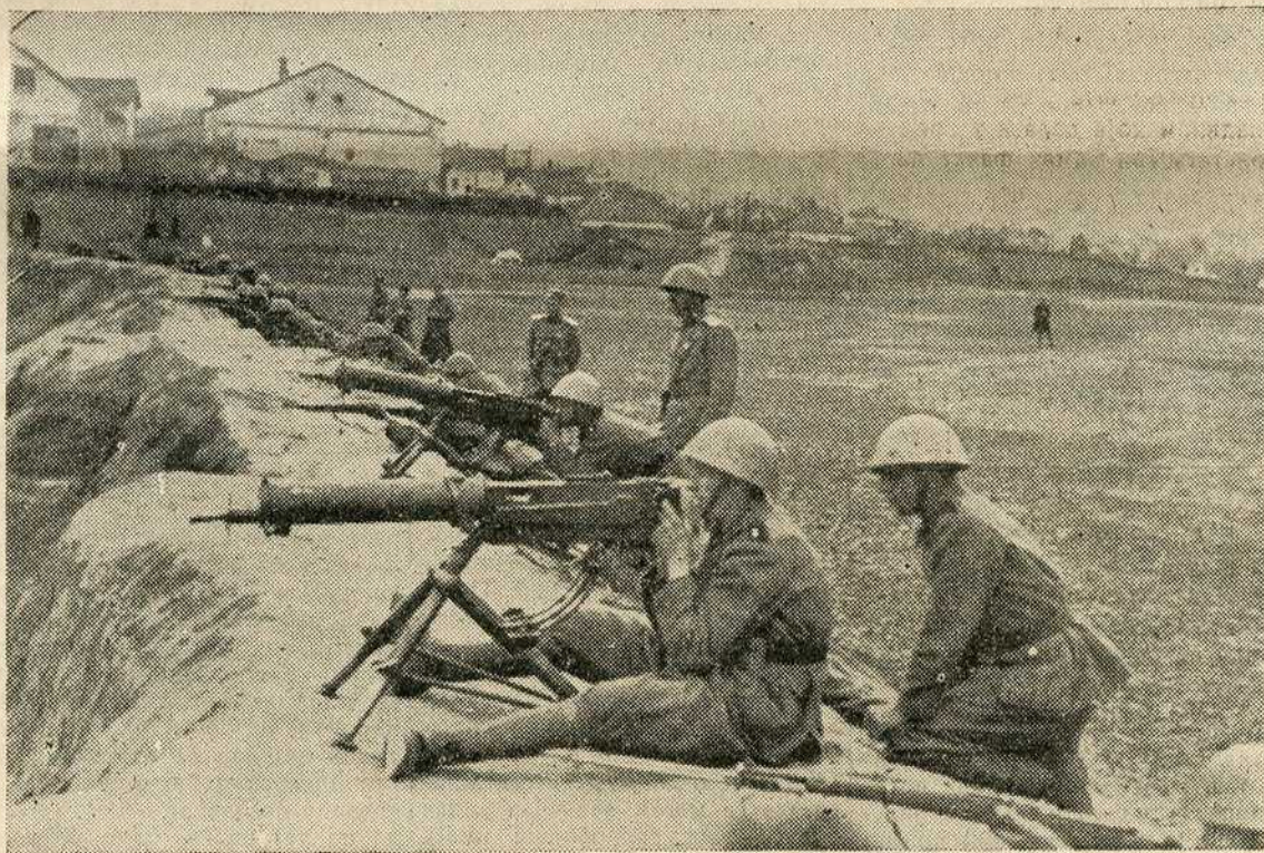
Добровољци на војној вежби