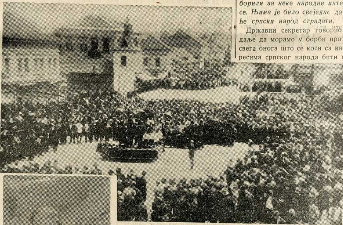
Државни секретар г. Ц. Ђорђевић говори на великом народном збору у Лесковцу

Државни секретар говорио је даље да морамо у борби против свега онога што се коси са интересима српског народа бити од-