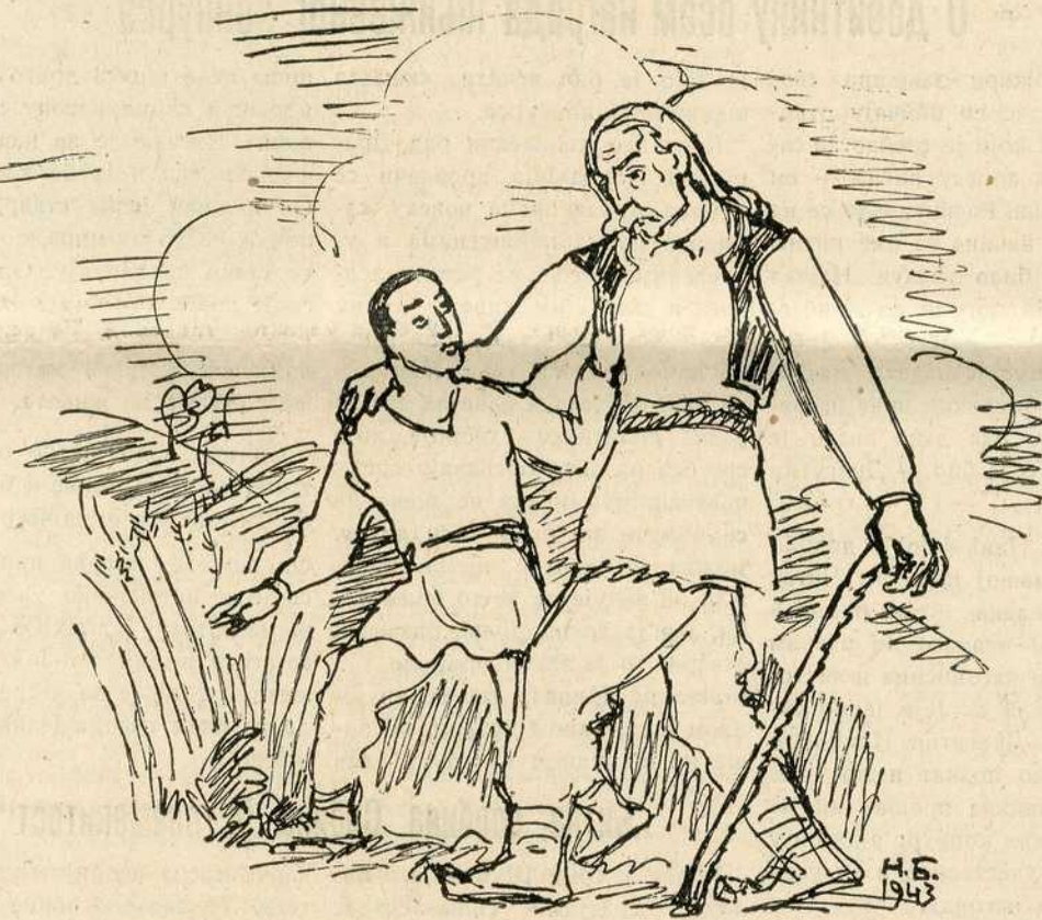
Цртежи: Н. Бешевић

већ само песму и здрав смех нашег лепог народа!..