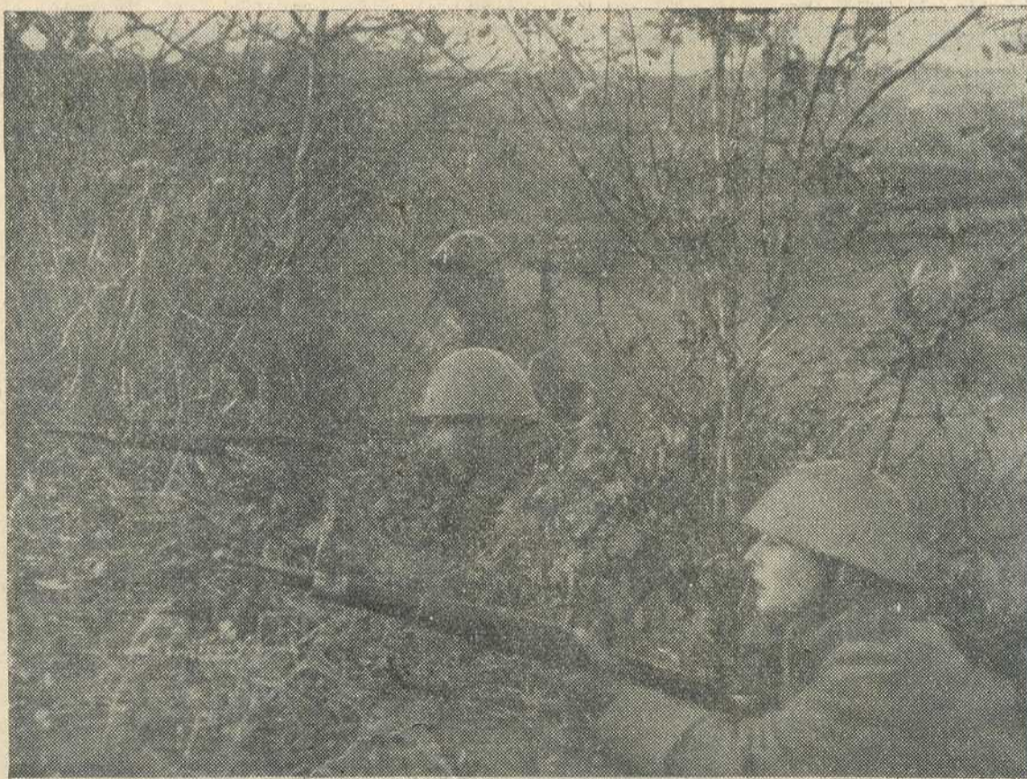
Добровољци су заузели погодан положај, који им омогућава да постигну прве поготке...