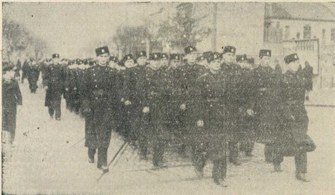
Одред Српске гарде маршира

У Београду сабирну акцију врше сва професионална удружења за своје чланове, а почасни сарадници Србозава међу радницима појединих фабрика, предузећа и радионица. За окружна места акцију врше окружни одбори Заједнице привредника, а за остала места у Србији месни одбори.