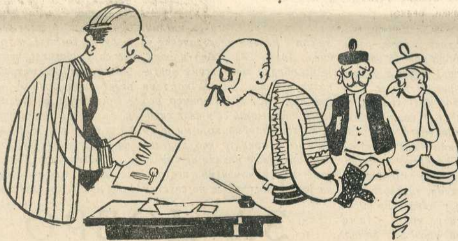
(Цртеж: С. Богојевић)