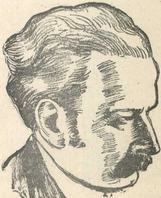
Ервин Гвидо Колбенхајер