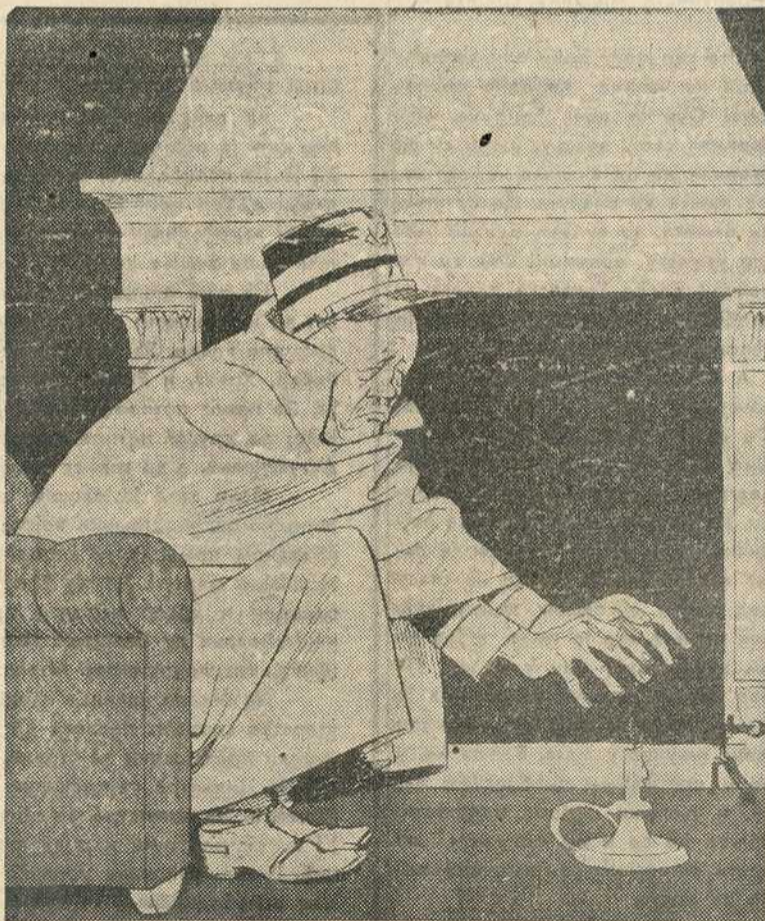
Издајник Бадолџ греје се на свећи место на обећаном углу Британо-американца

»Тријемимо губу из торине! Др М. Спалајковић