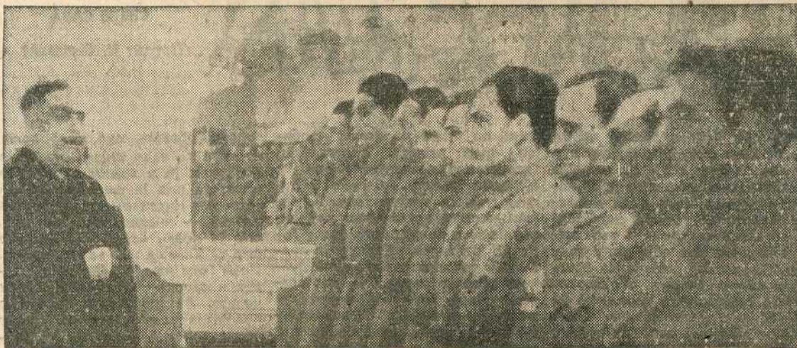
Генерал Недић поздравља омладинце