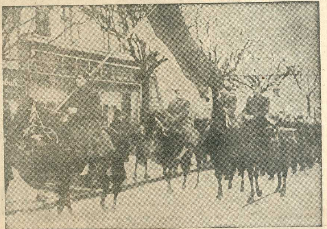
Добровољци — бадњачари