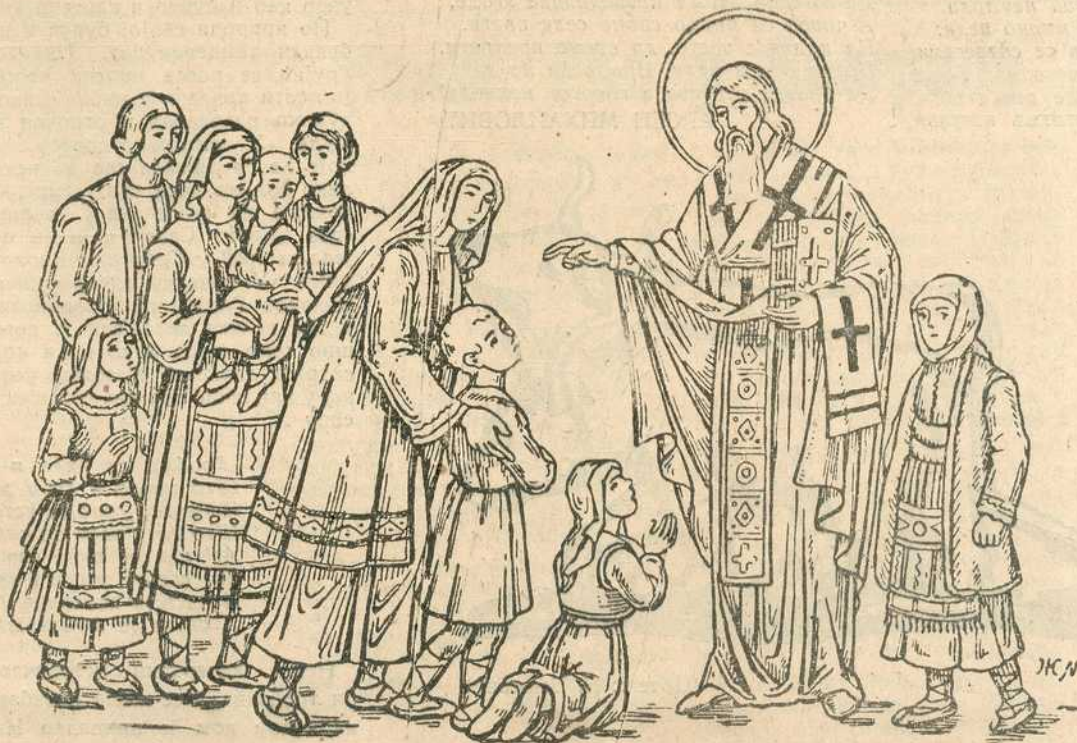
Св. Сава благосиља Српчиће