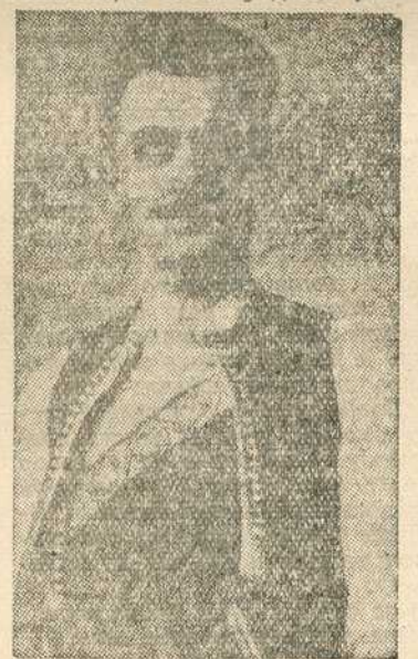
Алекса Шантић (снимак из млађих година)

дени живота као вечерњи цвет затворила за људе и свет; и наше чисто детињство, и нашу све ту матер, и весели сјај домаћег огњишта, и топлоту давно разо-