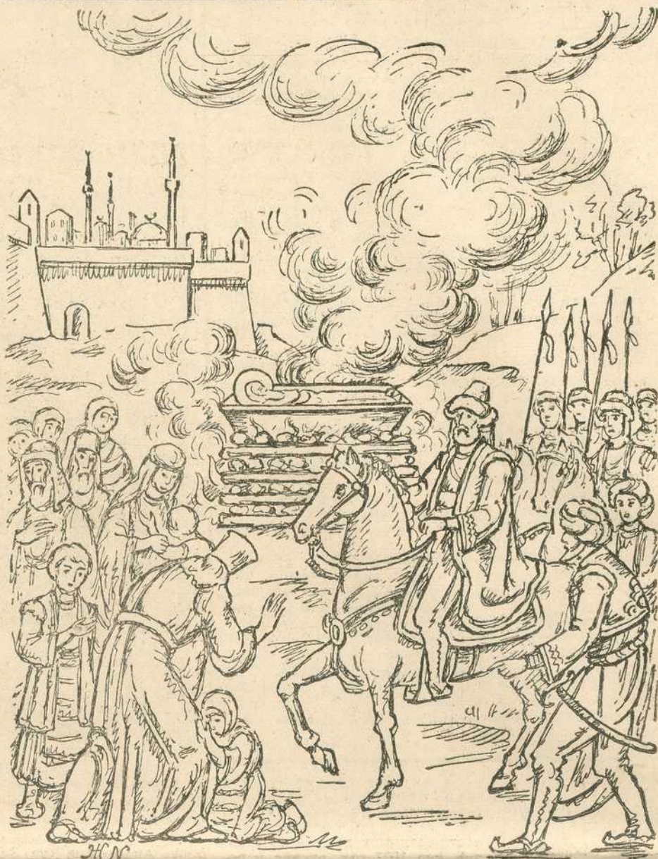
Ж. НАСТАСИЈЕВИЋ: СПАЉИВАЊЕ МОШТИЈУ Св. САВЕ