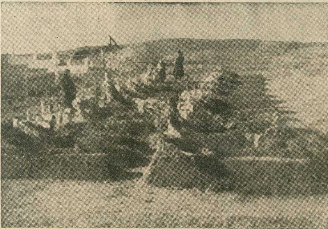
Гробови погинулих добровољаца код Сјече реке на ужицком гробљу