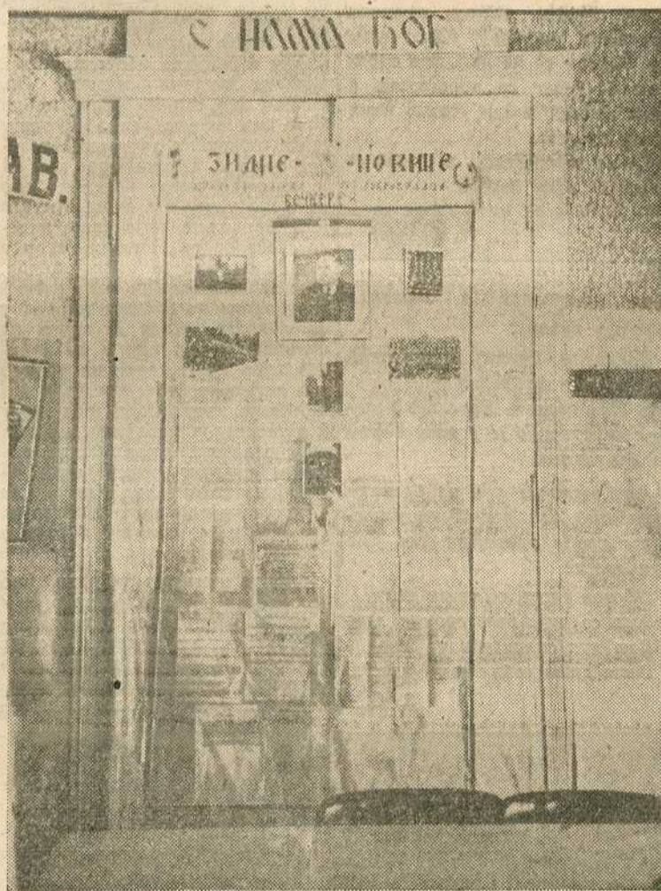
»Зидне новине« имају важну улогу у свим добровољачким јединицама. Слика приказује први број »Зидних новина« у новоотвореној добровољачкој читаоници у Петровграду

И само, кад је требало нахушкати Србе, кад их је валаљало увалити у рат само тада се почело ласкати Србима и ударати по њиховим танким и сентименталним жицама. А чим се и то свршило; кратко време после нашег слома, Лондон је одмах отпочео своју стару игру протежирања других мимо и изнад Срба што се осетило и у југословенској емиграцији и у лондонској пропаганди и у целој поли-