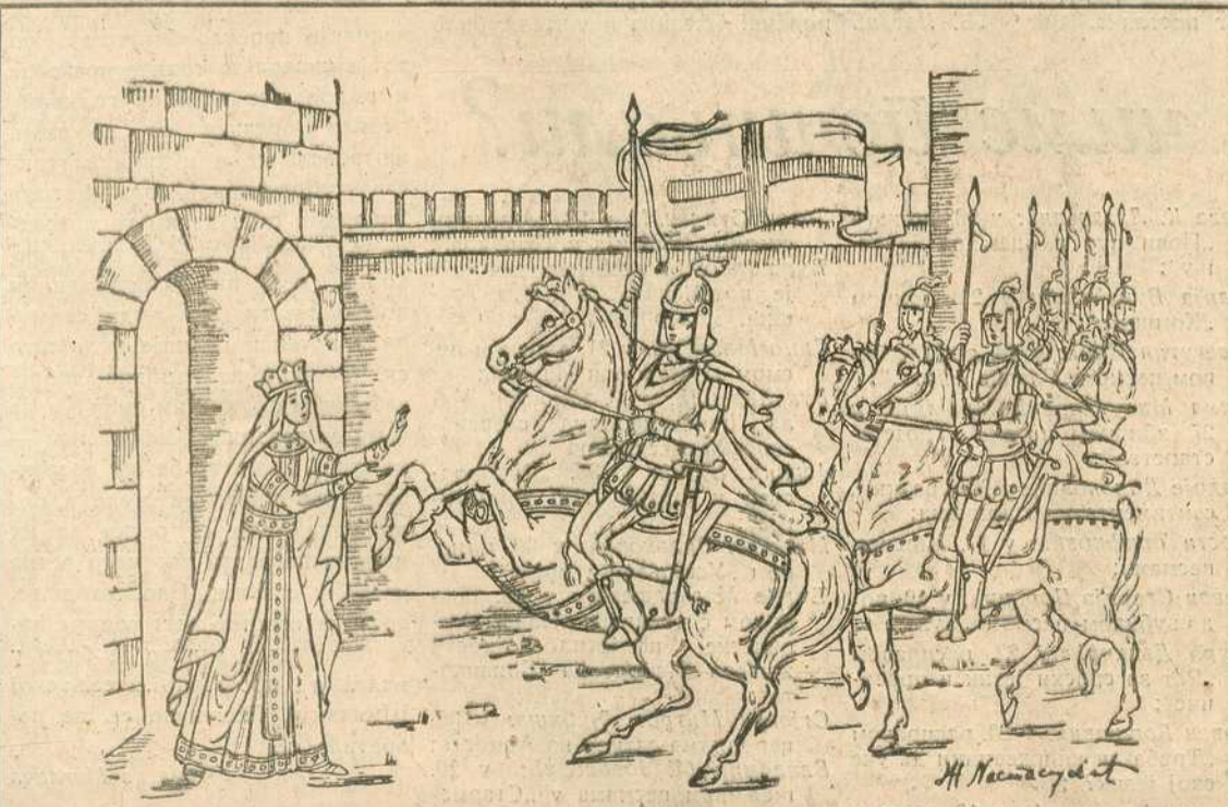
Ж. НАСТАСИЈЕВИЋ: ЦАРИЦА МИЛИЦА И БОШКО ЈУГОВИЋ

Симфониски социјалан, Бранимир Ћосић тек је био на прагу песника своје средине.