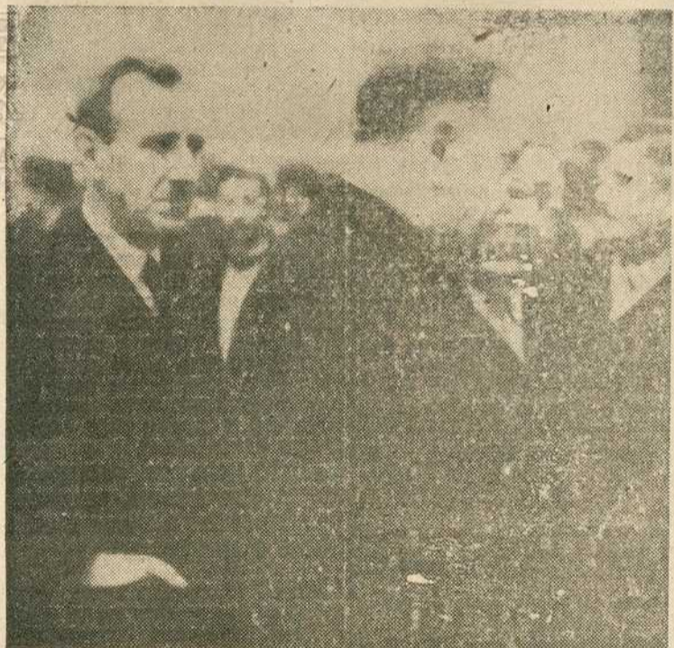
Последњи снимак пок. Масаловића у пратњи Претседника владе приликом пријема избеглица

Губитак је тежак, рана је непробална, јер мало је данас љу-