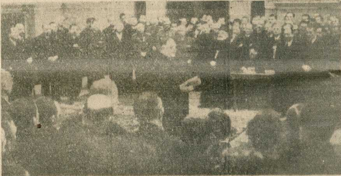
Председник владе, генерал Недић говори пред окупљеним избеглицима

„Драга браћо моја, ја вам захваљујем што сте ме саслушали. Захваљујем вам у име Отаџбине, у име Мајке Србије (Бурни и дуготрајни поклици: „Живела