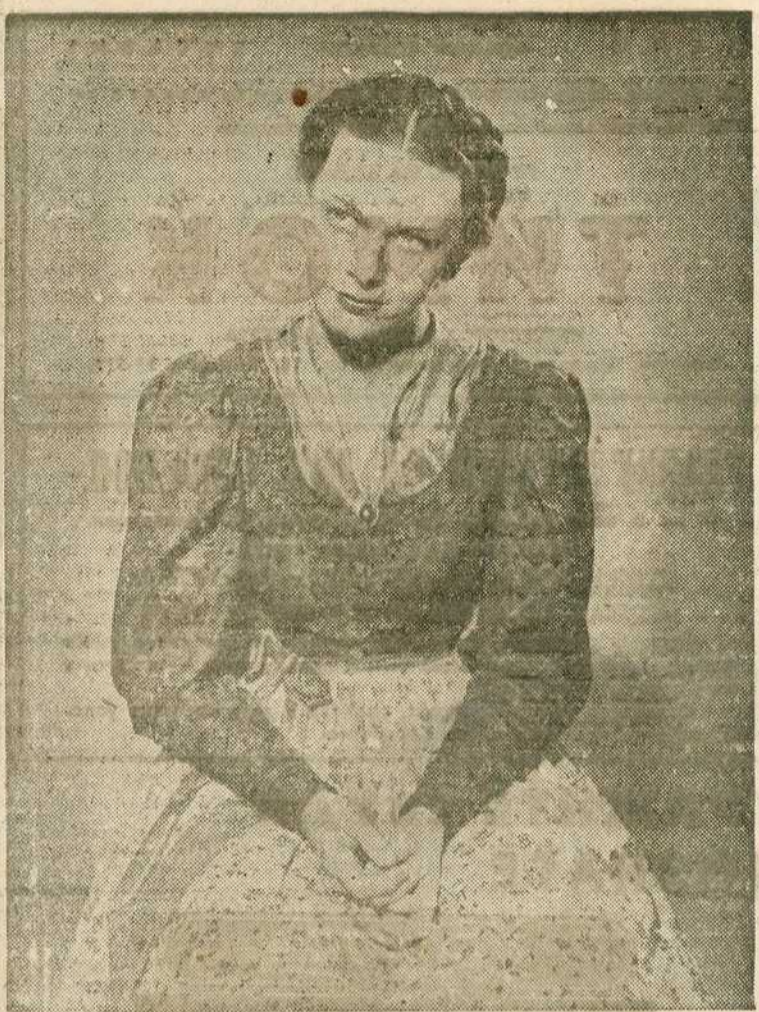
Илзе Вернер у једној од својих најбољих улога (Славу)

Илзе Вернер, једна од наше омладине, љубимица наше публике, налази се у Београду. Огромне масе обожаваоца дочекале су је на станици, велики редови су од ранага јутра чекали на карте за њене приредбе. Београђани, који су толико пута доказали како умеју да цене уметност, овога пута посведочили су своју гостољубивост, примајући Илзе Вер-