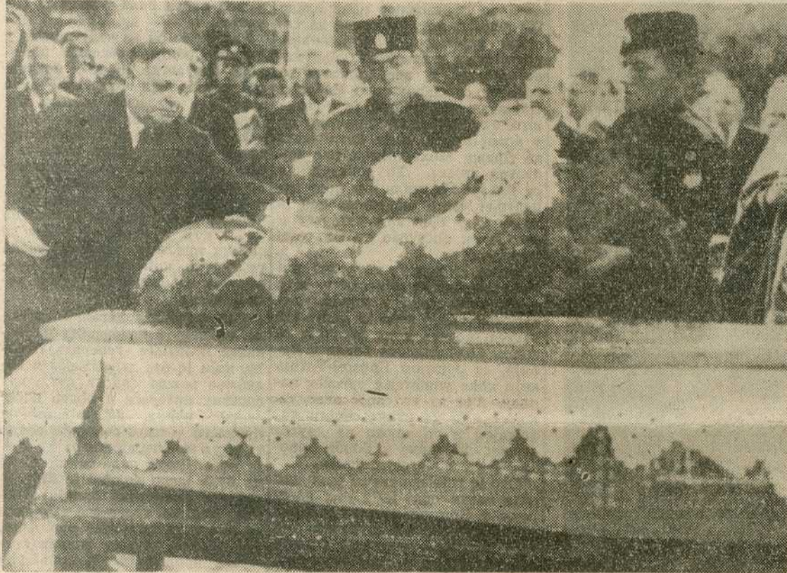
Претседник Српске владе полаже свој венац у знак признања

А над тим рушевинама једног Београда, над тим лешевима не-виних београђана, радио Лондон је цинички објавио како су 750 англоамеричких авиона бомбар-довали 18 маја железничке об-јекте у Београду и Нишу.