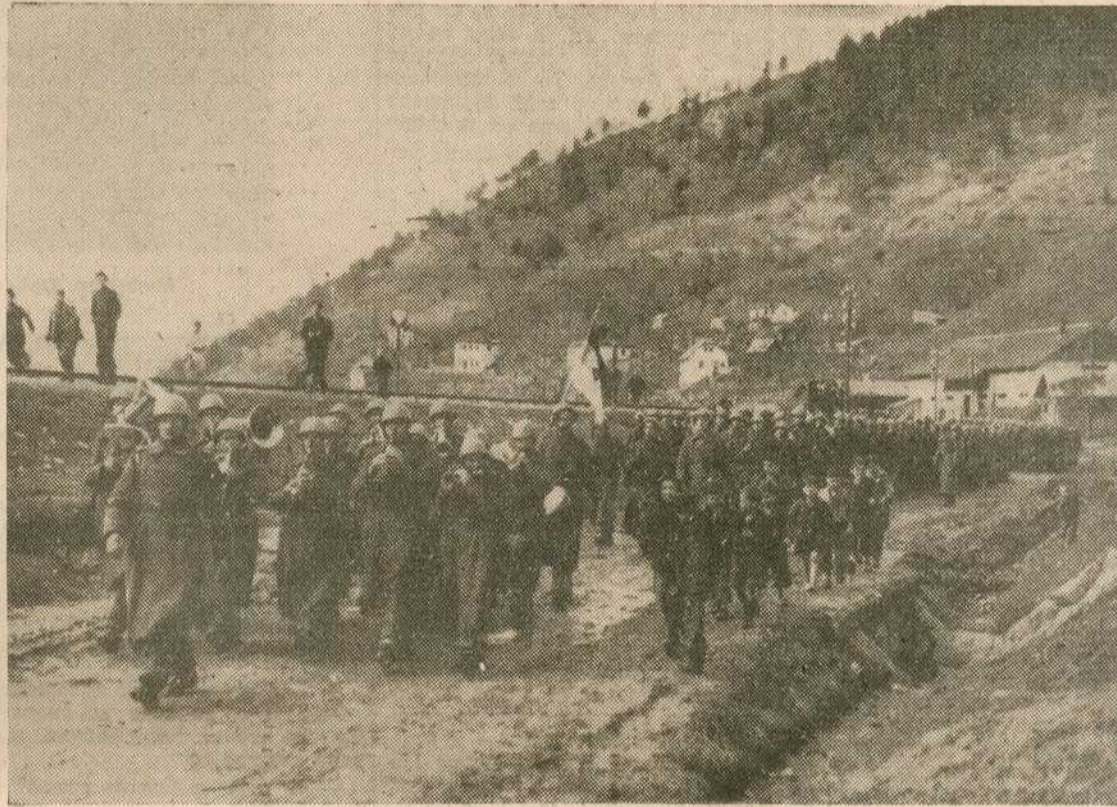
Добровољци на домаку Прибоја...

комунистичке опасности. Српски народ је прогледао.