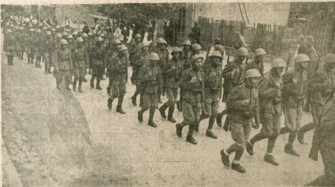
Један одред добровољаца се враћа после успешне борбе против Титових банди

Благослови, Добри, њихов пут што сјаји, Трубу мртвих, увек пуну Твога даха. И на вечној бразди њених корачаји, Мач мртвих позлаћен златом Твога праха.