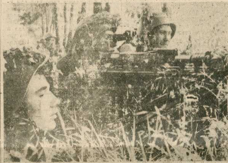
На бранику отаџбине

Носи мора крви да их не покраду Носи, реко српска крв невиних жртви Радосне победе хероји нам даду, Али страшну правду извојув мртви.