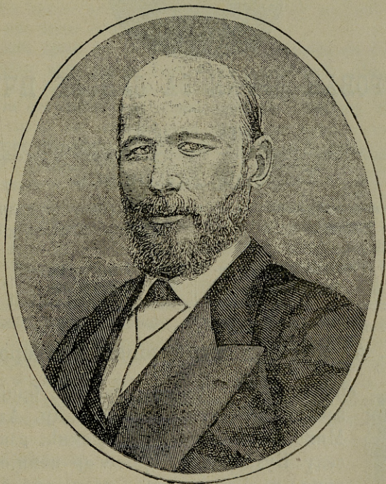
Др. Александар Михајловић Бутлеров.

славног научењака руског Александар је показивао још у детињству особиту даровитост. Док није пошао у казанску гимназију, учио се код куће уз надзор своје тетке. Гимназију је свршио навршивши тек шеснаест година. Отац хтеде од њега створити математичара, али он није марио за математику него се одао са великом вољом на изучавање природних наука. Ову науку изучавао је не само на предавањима и у лабораторијама