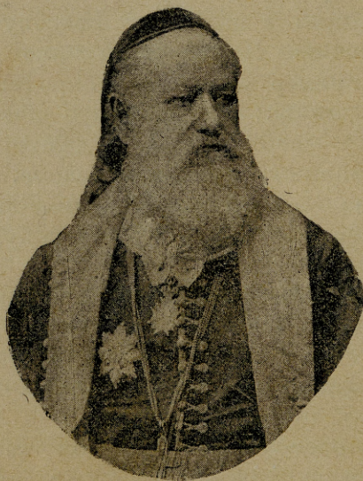
Његова Светост Георгије Бранковић српски патријарах.