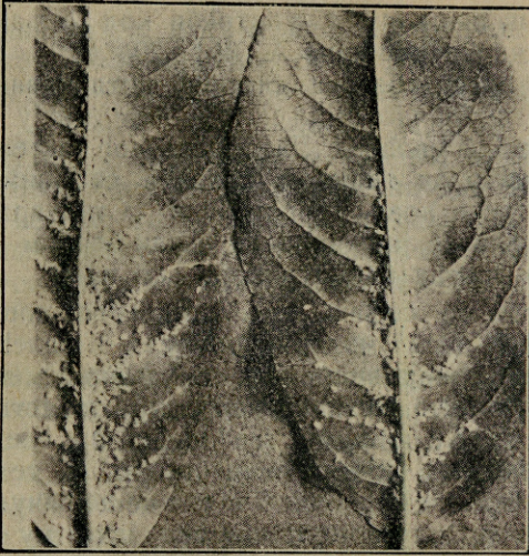
Сл. 1. Колонија бресквине лисне ваши ( Aphis persicae ) на послу. — Оригинал.

брзо се размножава и у првој половини јуна сам нашао већ приличан број крилатих женки.