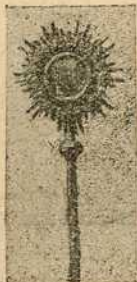
Рипида масном бојом парађене иконе од лима waschgold позлата 7 ф. 50 п. (или 15 крупа) и месни подлато 10 фор. 50 п. (или 21 крупа).