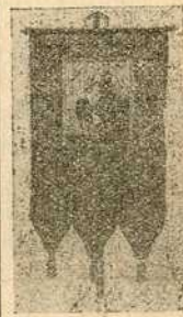
Барјак вулени д.маст 26 фор. (или 52 крупе) свилени 40 до 50, 65—80 фор. (или 130—160 крупа)

Моју позлатарску радионицу препоручујем за израђивање свију могућих црквених послова: нове иконостасе, тронове, Христове гробове, певнице, столове, као и оправку старих послова итд. Многобројна пријавнања и сведочења важе за солидну и поштену послугу. 21 1—3