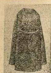
35, 45, 55 фор. (или 70, 90, 110 крупа.)

„Српски Сион“ излази сваке недјеље на целом тађаку. Цена му је: За Аустро-Угарску, Босну и Херцеговину на годину 8 крупа, на по године 4 крупе, а на четврт године 2 крупе. За стране земље: на годину 10 крупа. Из Србије прима претплату књижара В. Валожина у Београду. Поједини бројеви 20 филира.