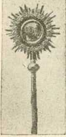
Рипида масном бојом израђене иконе од лима washgold позлата 7 ф. 50 и (или 15 круна) и месинг политирато 10 ф. 50 и. (или 21 круна).

Дунавска улица У НОВОМ САДУ Код Златног крста РАДЊА ПОСТОЈИ ОД 1883. ГОДИНЕ.