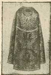
35, 45, 55 ф. (или 70, 90, 110 круна.)

За набавку строго српских правосл. утвари, у сонетеној изради а јефтином ценом препоручујем моју хришћанску позлатарску радионицу и богато стовариште. По чудо јефтиној цени може свака славна српска православна црквена општина себи црквене утвари набавити, као: одежде, барјаке, литије, школке и све задружне заставе, небо, стишаре, завесе, налоње, застираче на часну трапезу, плаштанице, појасеве. Даље: рипиде, кандила, чираке пред двери, чираке-трикиле, крстове, кивоте за часну трапезу, петохљебнице, бројанице, разне ручне крстове, радионице, путире, ибрике, венчанице, полијелеје од стакла и бронза. Иконе на платну, лиму и дрвету, руком рађене масном бојом за целивање. Руске иконе у сребро и злато коване, као и на артији и стаклу.