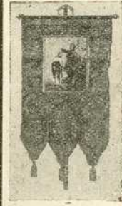
Барјак вуњени дамаст 26 ф. (или 52 круне) свилени 40 до 50, 65—80 ф. (или 130—160 круна)

Многобројна признања и сведочење важе за солидну и поштenu израду.