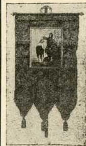
Барјак вулени дамаст 26 ф. (или 52 круне) свилени 40 до 50, 65—80 ф. (или 130—160 круна)