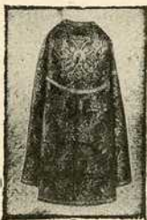
35, 45, 55 ф. (или 70, 90, 110 круна.)