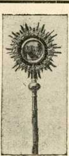
Рипида масном бојом израђене иконе од лима washgold позлата 7 ф. 50 и. (или 15 круна) и месинг политирато 10 ф. 50 и. (или 21 круна).