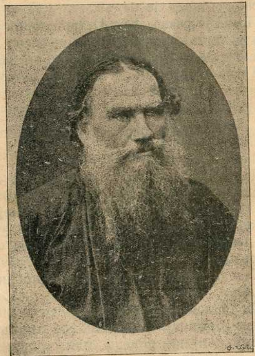
† Лав Николајевић Толстој.

Био је гроф, богаташ, милионер. Али ни части, ни благо, ни слава велика, коју је стекао као један од најславнијих књижевника свију вијекова, нису га узнијели. Штогод је постајао славнији међу људима, све више је долазио до увјерења о слабости и грјешности и малоћи својој и све више настојао да не силази са пута добра, истине и правде, све више се трудио да се усаврши и поправи и приближи Богу, живећи животом чистим, љубећи све људе, заклањајући све несрећне, биједне, помажући си-