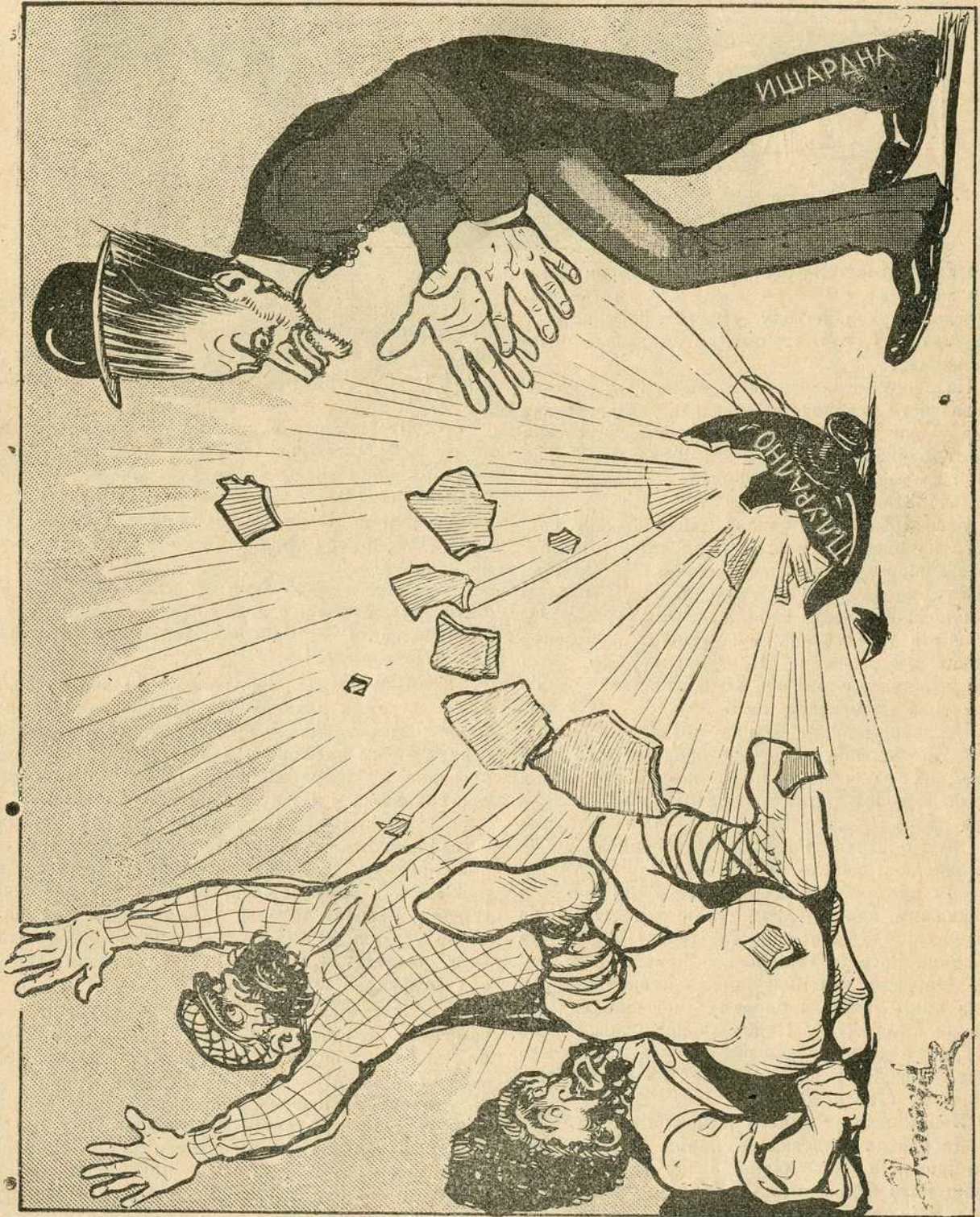
Пукла — тиква!

У Н И В Е Р З И Т Е Т С К А Б И Б Л И О Т Е К А