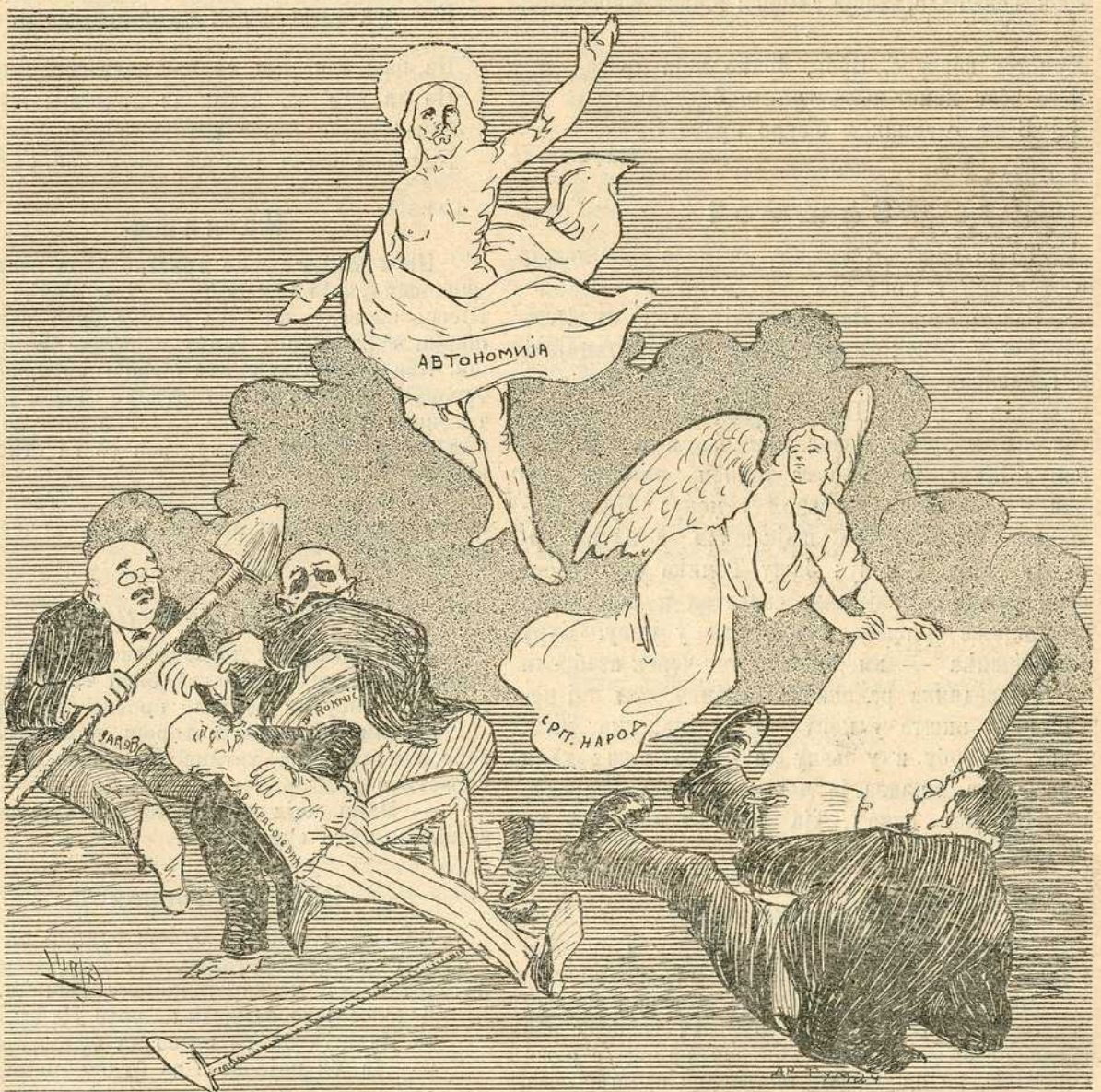
Народ (гробарима): Ваистину воскресе!