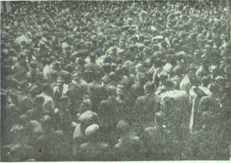
Један део посејшлица у дворшћу

То су биле ријечи претставника двадесетдвје организације омладине наше земље, то су они рекли пред више од де-