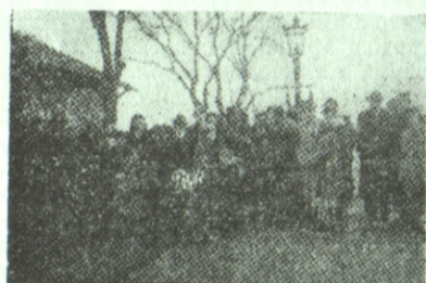
Група са сељацима

Пошли смо да њих чујемо и слушали смо их. Сви причају и питају о рату. „Знамо ми све и ако не читамо сваки дан новине. А оно и шта има много ту да се зна, брате. Једно, ко оче наш, ко свакидашњи хлеб за кога зна свако дете у колеци, једно, брате, да се не дамо. Нисмо је лако добили па да је лако дамо. Држиш цену и не погађаш се“. Хтели би и ми да кажемо исто, али већ они знају, знају за нас. „Слушали смо ми за вас још прошле године. Кад сам једном путовао лађом, причао ми један пријатељ“... Знају они шта би им могли да кажемо данас.