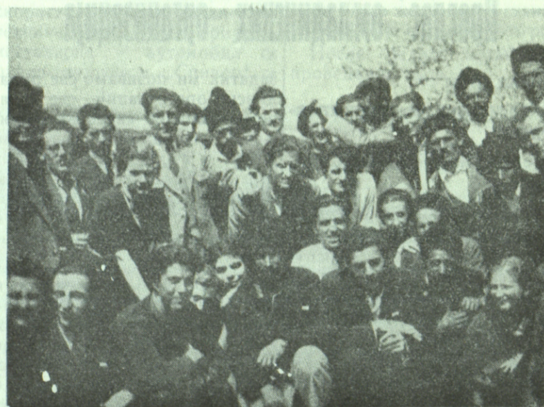
Још једна група са сељацима

Један стари грађанин пријатно дирнут и узбуђен кроз сузе разговара с нама. Читави сат не престаје да плаче. Узбудљиво нам прича о патњама под туђином. Говори о потреби