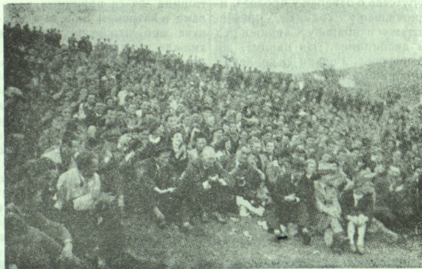
Студенти слушају програм