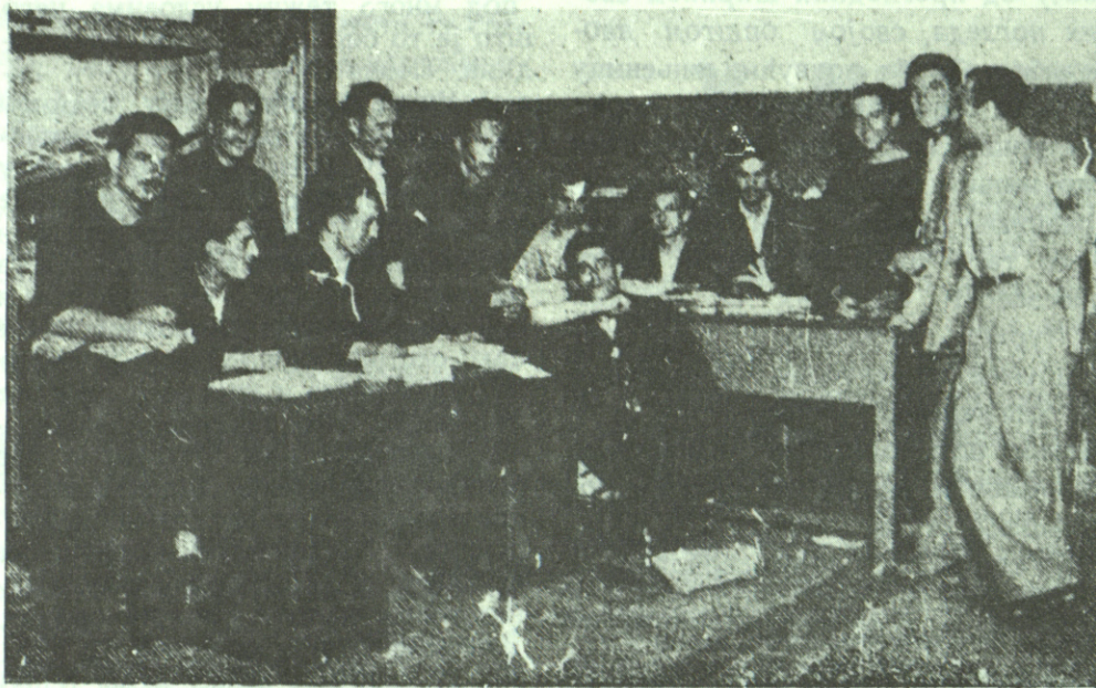
Студентска задруга „Самопомоћ“

Од тада је скоро сав терет око збрињавања студената пао на наше