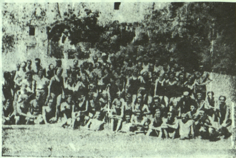
Студенти на летовању у Петровцу на мору