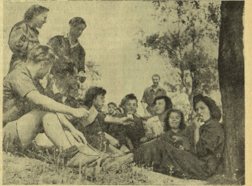
Омладинци бригаде из Јулијске Крајине

Радне бригаде Народне студентске омладине Београдског универзитета очекују на Омладинској прузи тешки и одговорни задаци Али студенти-бригадери радних бригада „Мике Митровића“, „Соње Маринковић“, „Др. Симе Милошевића“ и других показаће још једном да је Народна студентска омладина способна за извршење сваког задатка и за постизање највећих успеха.