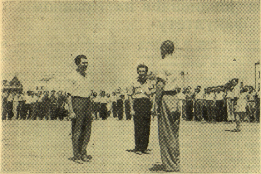
Са смотре радних бригада НСО-а

На ледина иза Техничког факултета било је тог дана необично живо. Некако свечано и нестрпљиво расположење увуло се у очи сваког бригадира. Свакога часа пристижу групе општинских младића и веселих девојака наговарених пртљагом, порцијама, књигама. Студентска бригада има збор пред полазак.