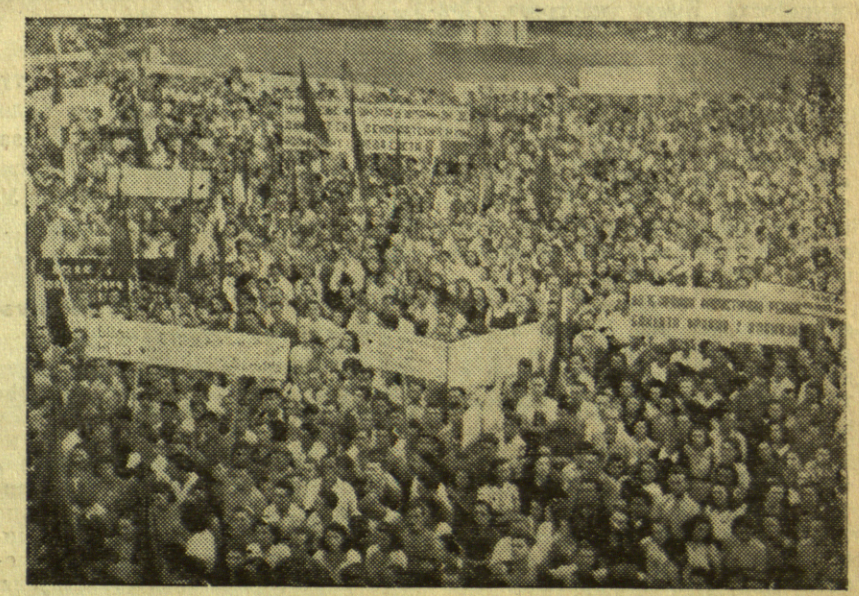
Око 100.000 људи учествовало је на протестном митингу против францког режима