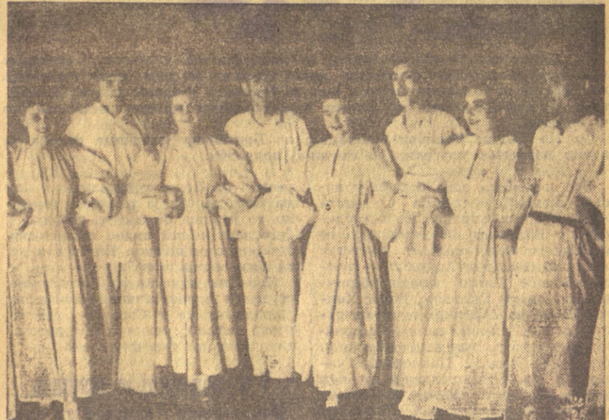
Претходногodiшњи победник, фолклор КУД-а Пољопривредног и Шумарског факултета „Соња Маринковић“ иступила на Фестивалу са пет сплетова. На конкурс 12 априла нарочито добро су изведени војвођански сплет и македонски оро.

На слици: Војвођанска група изводи сплет.