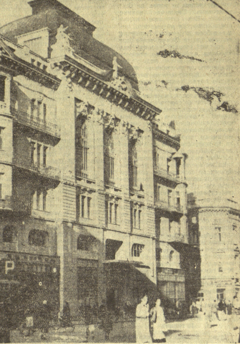
Приводе се крају радови на згради Академије наука

Централни дебатни клуб има у плану за новембар месец предавање са дискусијом о уџбенику „Теорије