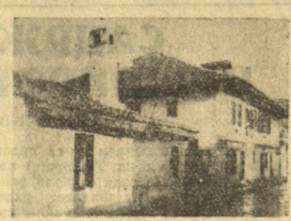
Велика школа из 1863 године

Економски услови и тежња за што ширим културним животом, постављали су као један од главних услова проширење више наставе што је и довело до отварања Лицеја у Великој Школи (Академији) 24 септембра 1863 год. Већ први члан Закона о устројству ове установе одјео карактер који је Велика Школа требало да има. „Велика Школа научно је заведена за вишу и стручну изобразбу.“ Према чл. трећем овога закона, Школа има три факултета, или, како су се онда звали одељења: филозофски, технички и правни. Филозофски факултет се студирао три, а технички и правни по четири године. Поред предмета који су слушани на овим факултетима, студенти су морали да слушају и поједине предмете са остала два. Тако на