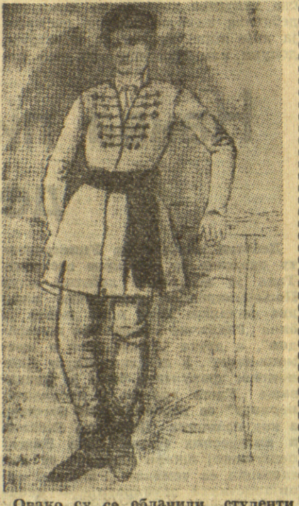
Овако су се облачили студенти Велике школе