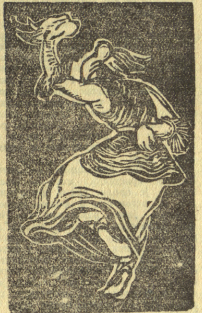
Наташа Тодоровић — фолклор —