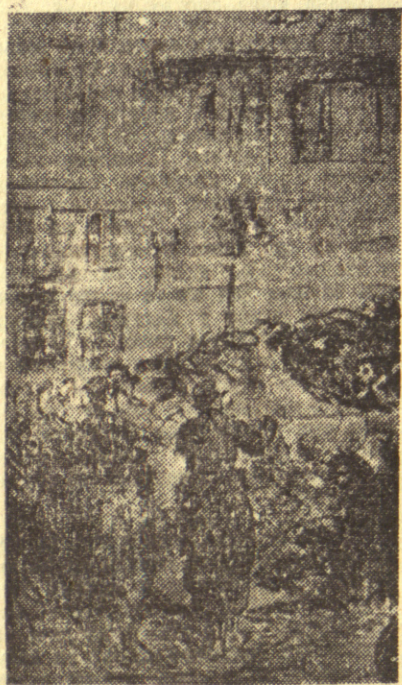
Мане: Барикада, гравура

16 марта у 20 ч.: „Један свет прожет непомирљивим супротностима“. Дебатни клуб факултета. Сала 56.