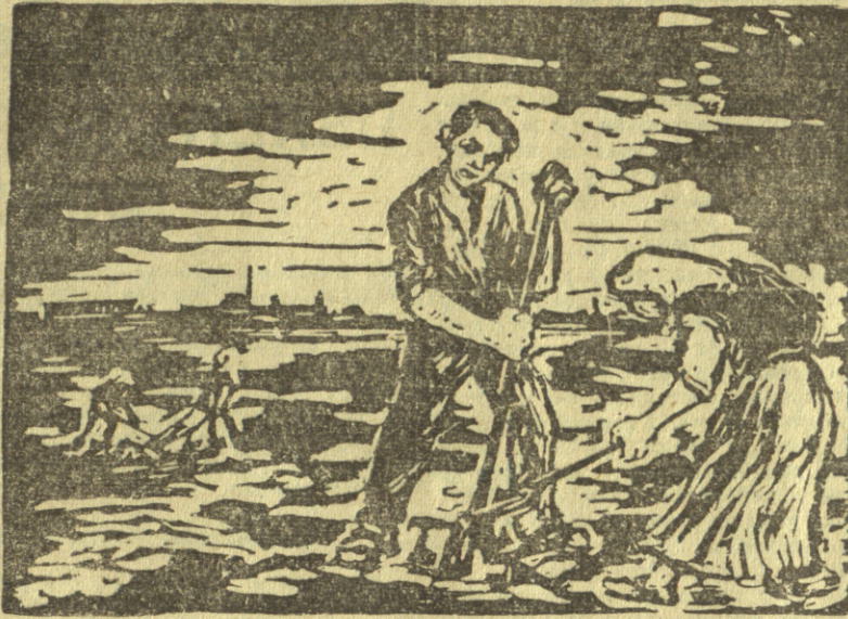
МИРЈАНА ШИПОШ — На раду (линорез)