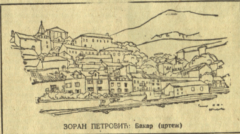
ЗОРАН ПЕТРОВИЋ: Бакар (цртеж)

Управа друштва је створила за последњу годину детаљан план. Предвиђено је шта ће која секција да спрема, одређени су наступи, тачан број чланова за сваку секцију итд. итд. Но, у управи се ипак нечег плаше. Ту скоро организована је анкета која је имала за циљ да испита вољу студената за рад у појединим секцијама факултетских удружења, преко којих ће се одвијати делатност Са-