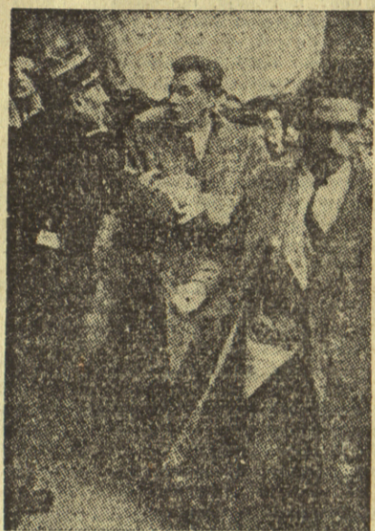
Детаљ из мартовског штрајка

литичка схватања. Свака група вуче на своју страну. Карактеристично је да студенти слабо излазе на парламентарне изборе. Због тога су и све политичке партије заинтересоване за