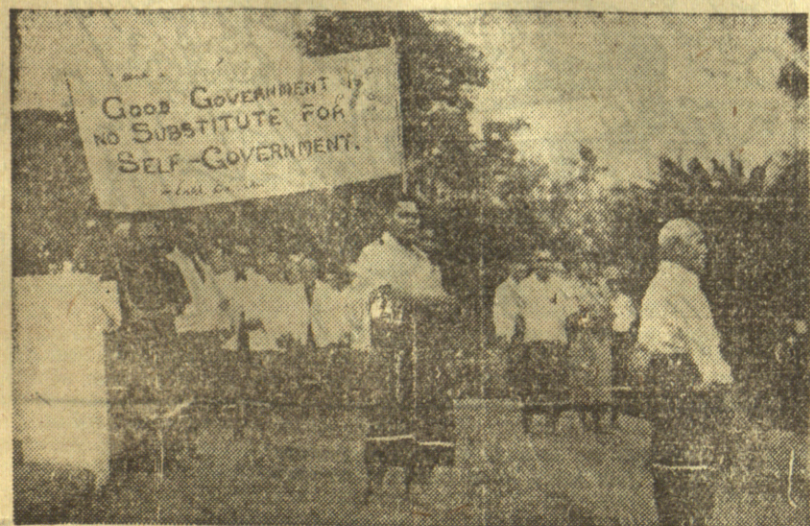
Делегације народа са Западног Самоа (Пацифик) дочекује мисију ОУН са Транспортом „Самоуправа не може да замени никакву управу“.

вором да није добро формулисана, да је предвиђени рок од 10 година прегуд и зато јер је Италија „бивша фашистичка земља“ одређена за администратора. Из овог произилази да ранијих година, када се СССР заузимао да Италија буде одређена за административну силу, да тада Италија није била „бивша фашистичка земља“; она то постаје тек 1950 године! По питању Либије, делегација СССР-а оштром критиком напада управне власти али не због интереса народа у Либији већ са искључивим аргументом да се у Либији граде војно-ваздухопловне базе које директно угрожавају интересе СССР-а. Због тога је предложено давање потпуне слободе и независности и предају власти Либији као и потпуну демилитаризацију у року од три месеца. По питању Еритреје, Совјетски Савез мења по седми пут свој став. Совјетска делегација се супротставља предлогу по коме Еритреја постаје аутономна територија у федерацији са Етиопијом и предлаже да се Еритреји да одмах независност. Интересантно је још напоменути да је, пошто је совјетски предлог био одбачен, пољска делегација дала други предлог вероватно по директиви СССР-а по коме би Еритреја постала независна после три године. Међутим, и тај предлог је одбачен. Сва срећа што је питање судбине бивших италијанских колонија решено, иначе, ко зна колико би пута совјетска делегација променила свој став.