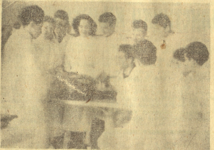
Студенти прве године Ветеринарског факултета на вежбама из анатомије домаћих животиња

Да би се ове тешкоће савладали у споразуму са студентима одржавају се репетиције по два часа недељно из градива које није довољно савладано. Уз то, „хладне учioniце“, нису више сметња за похађање предавања, те се надамо да ће заједничким напором студената и нас наставника бити савладано градиво до краја године, те да ћемо након крајњег испитног рока бити обострано задовољни.