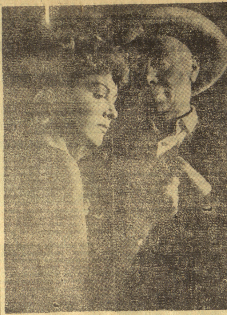
Сцена из филма „Без милости“