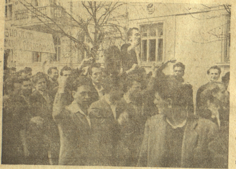
Демонстрације студената и грађана у Земуну

смех чак и онда кад на читавом фронту влада заштити. Духовито је приметно један војни обавештајач: — Наш је санитет толико у позадини да се одмах иза њега налази индустрија! Топови су се повукли у задњу линију, иза жбуња, а у ископанним рупама могу да се налаже и мале батре. То није опасно. Мала батрица око које се безбрижно ћерета до пред саму „битку“ код артиљераца је обавезна. Ту, на „ватреном положају“ неки се сећају дугих каиноваца са Сремског фронта а многи студенти нестрпљиво чекају да опале први топ. (Наставак на другој страни)