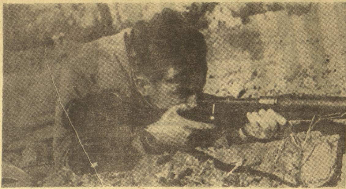
У првој линији сместили су се електротехничари. Они су морали бд првог до последњег часа да будно мотре на покрете „непријатеља“.

Нас ови совјетски маневри не збуњују. Ни једног тренутка нисмо поверовали у промену њиховог става, нити некакву жељу за стварним миром. Однос према нашој земљи демаскира их у очима наше јавности. И не само наше. Чињеница је да се совјетска политика дискредитовала, да има још већма мало људи који верују у искреност њихових речи. Чињеница је и то да совјети не могу више рачунати на војничку надмоћност у случају једног оружаног сукоба. То их приморава да навлаче јагњеће рухо испод кога не могу да сакрију вучје зубе.