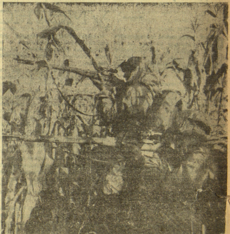
СА МАНЕВАРА ЈНА: ШНАЈПЕРИ