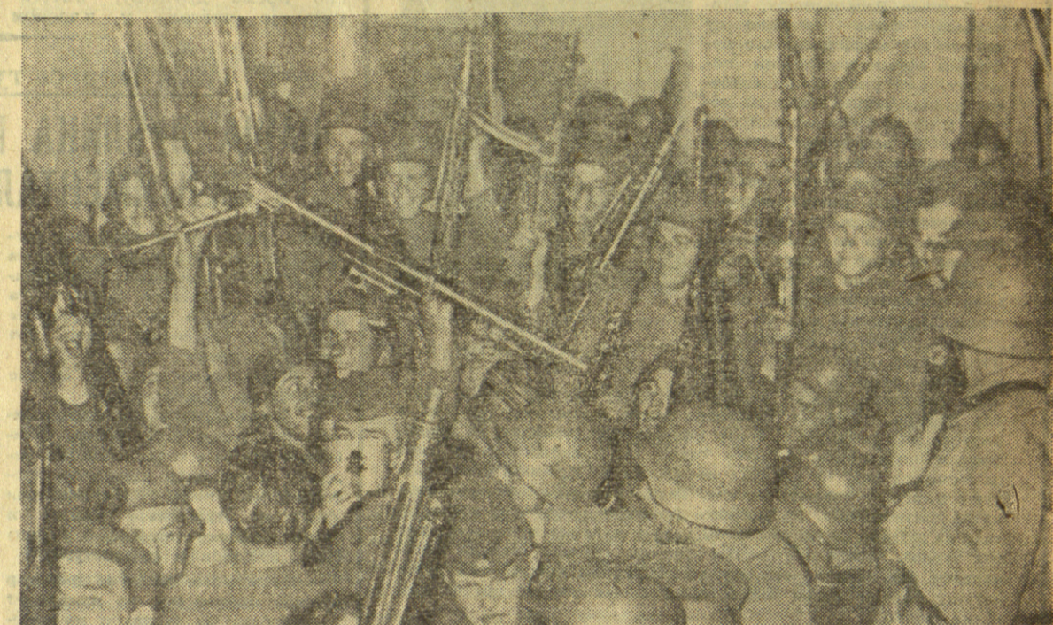
РАДОСТ ВОЈНИКА. НАРОД ЈЕ ДОШАО У ПОСЕТУ

рапорт да моли да и он крене. Касније је причао да би то био да га нису пустили његов најцрњи дан у години.