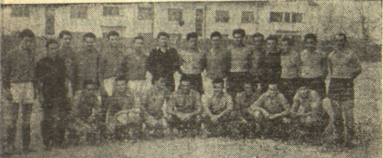
Екипе Саобраћајног отсека и Машинског факултета у појављивању финалне утакмице

Судија, судија... Судије на Купу ТВШ делегирао организатор. Обично су то