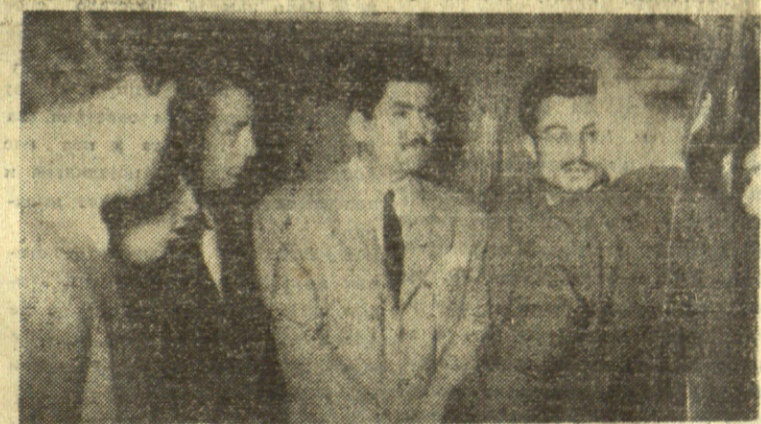
СА ПРИЈЕМА ТУРСКЕ ДЕЛЕГАЦИЈЕ КОД РЕКТОРА УНИВЕРЗИТЕТА