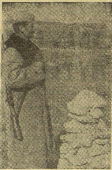
НА ГРАНИЦИ УНИВЕРЗИТЕТСКА ХРОНИКА