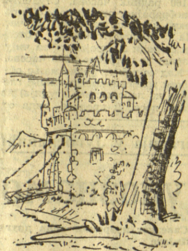
ЗАМАК У КОМЕ ЈЕ ОДРЖАН СЕМИНАР

На семинару била је једна чудна тема „Религија као средство за боље разумевање међу народима.“