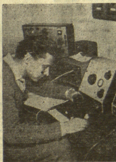
Проверавају се особине новосаграђене радно лампе

Савез за техничко васпитање студената претјече ће своју активност на све чланове УСС и у своје редове укључити што је могуће већи број наставника са Универзитета и Великих Школа. Треба